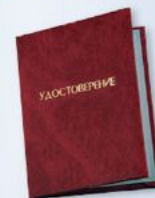
UD4 Размер: 110х80 мм Бумвинил, плотная бумага

ФУТЛЯРЫ ДЛЯ ЗНАКОВ «ГОТОВ К ТРУДУ И ОБОРОНЕ»