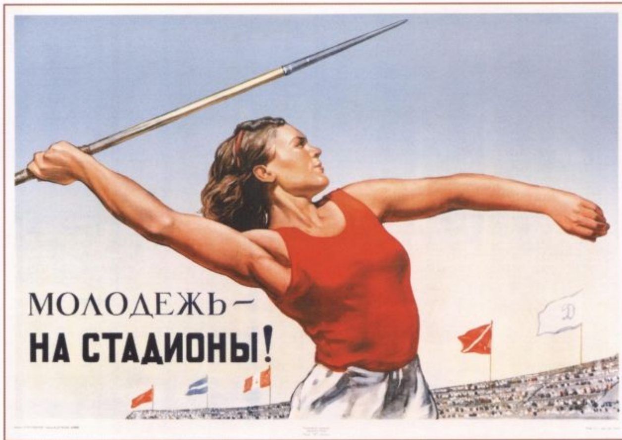
504. Голованов Л. Молодежь — на стадионы! 1947

С 2010 года программа начала свое возрождение.