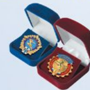
FU125a (бордо) FU125b (синий) Внут. размер: 45х42 мм

ПОДЛОЖКА В УПАКОВКЕ ДЛЯ ЗНАКОВ «ГОТОВ К ТРУДУ И ОБОРОНЕ»