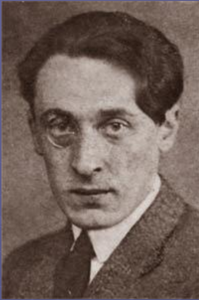
Бру́но Ясе́нский - польский и советский писатель, поэт, драматург

«Не бойся врагов, в худшем случае они могут тебя убить. Не бойся друзей, в худшем случае они могут тебя предать. Бойся равнодушных – они не убивают и не предают, но только с их молчаливого согласия существуют на земле предательство и убийство»