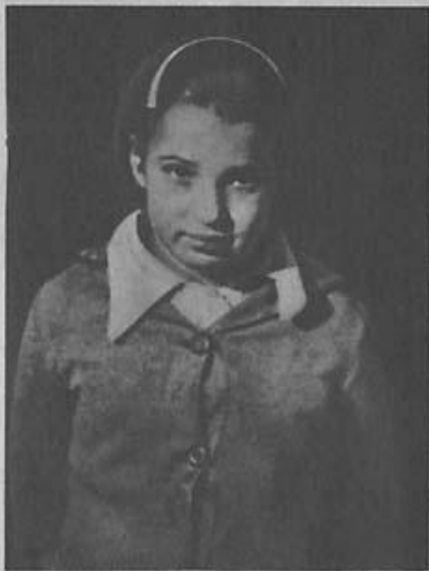
Таня Савичева. Фрагмент группового снимка