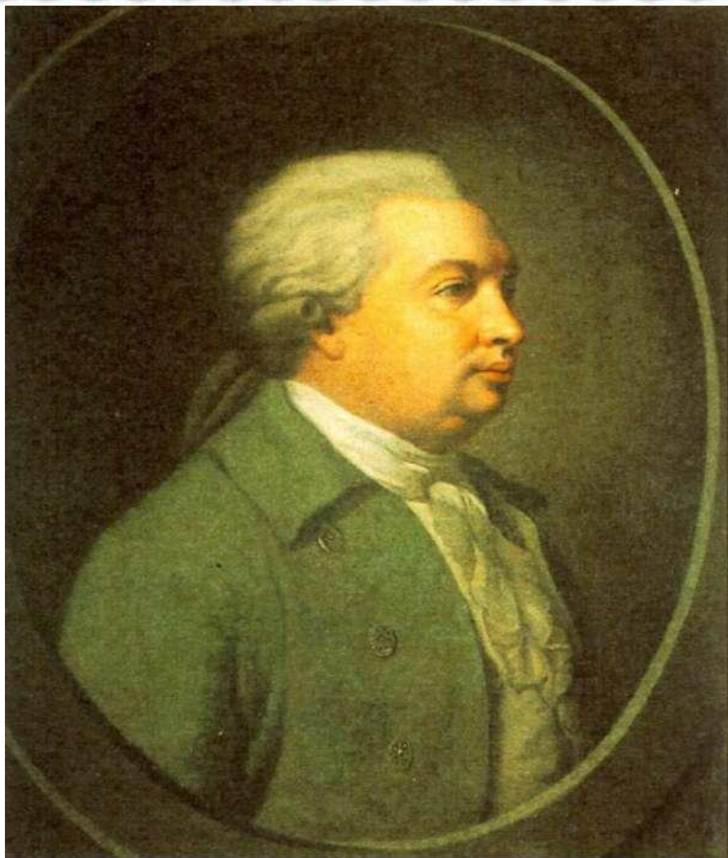
Денис Иванович Фонвизин