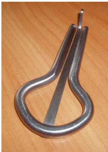
варган или кубыз.