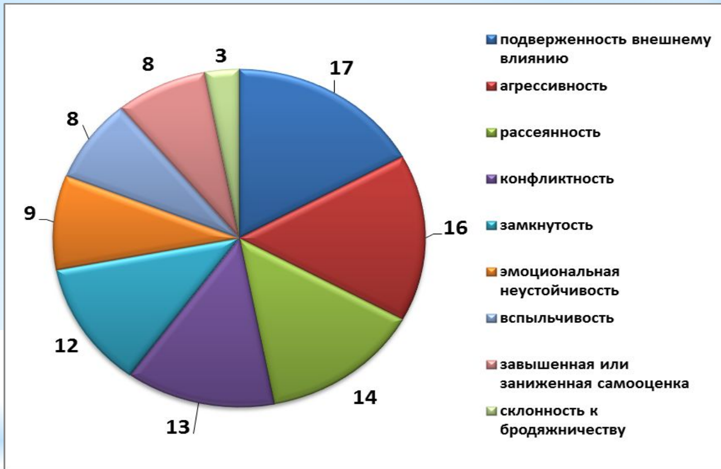
Диаграмма 4. Формы проявления психического нездоровья обучающихся (по результатам диагностики школьного психолога)