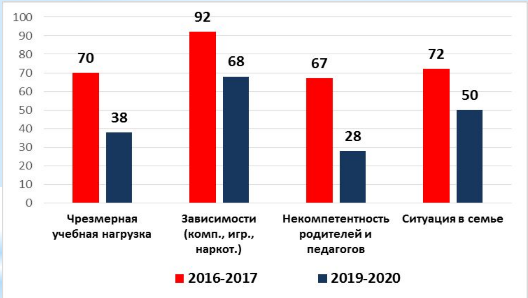
Диаграмма 6. Динамика изменений факторов риска для психического здоровья детей, посещающих занятия в центре (показатели за 2016-2017 и ожидаемые результаты на 2019-2020 г.г.) (в %)