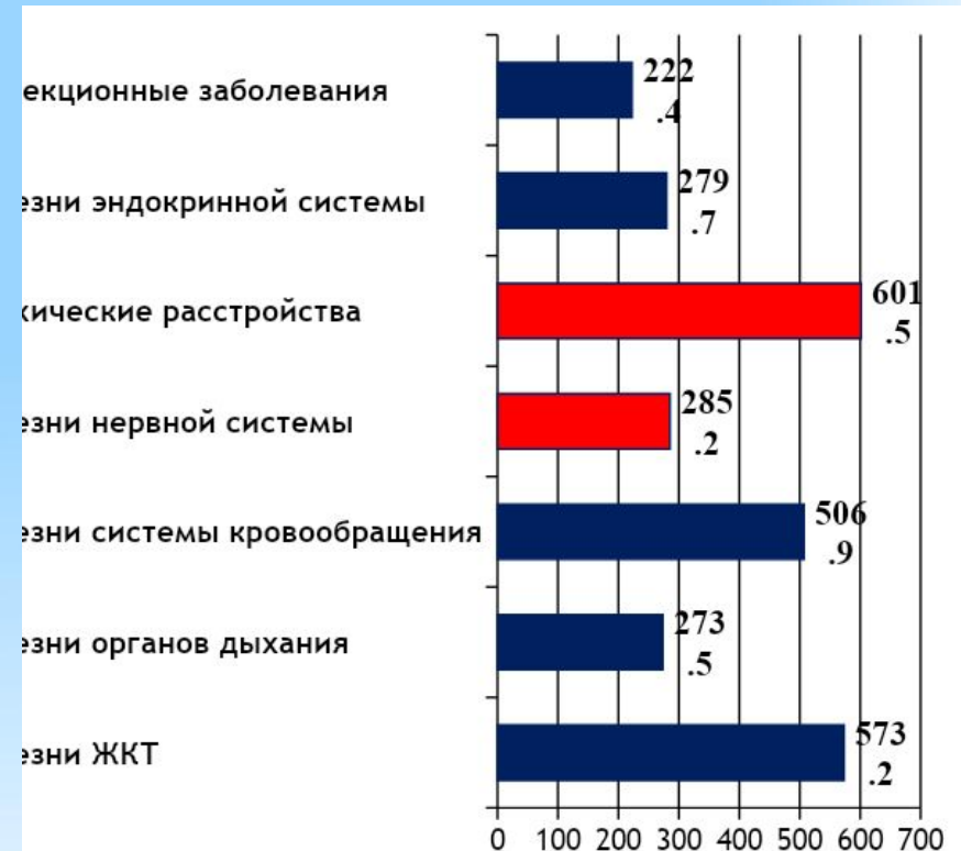
Диаграмма 1. Показатели по видам заболеваний обучающихся 10-11 классов по РФ (по данным за 2016 год) (в абс. кол. на 1000 детей)*

*Федеральный закон от 29.12.2012 N 273-ФЗ (ред. от 29.07.2017) «Об образовании в Российской Федерации» Статья 44. Права, обязанности и ответственность в сфере образования родителей (законных представителей) несовершеннолетних обучающихся