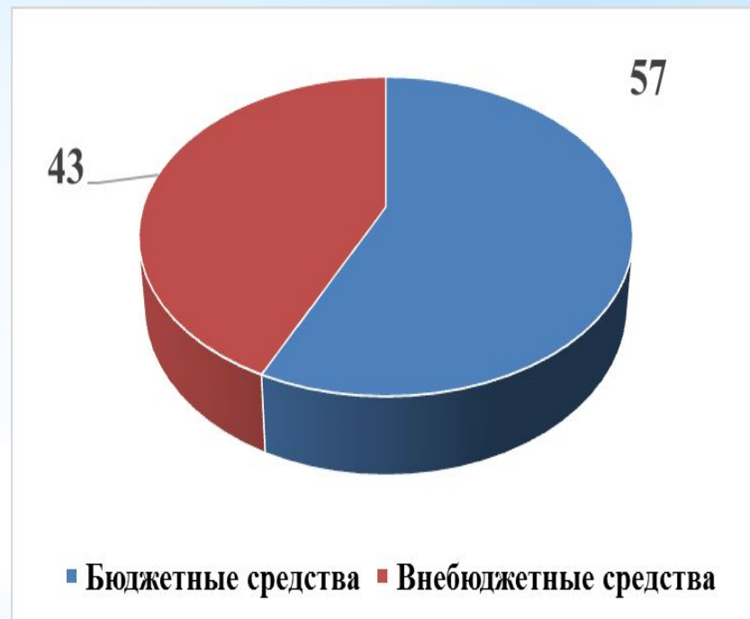
Диаграмма 5. Источники финансирования проекта