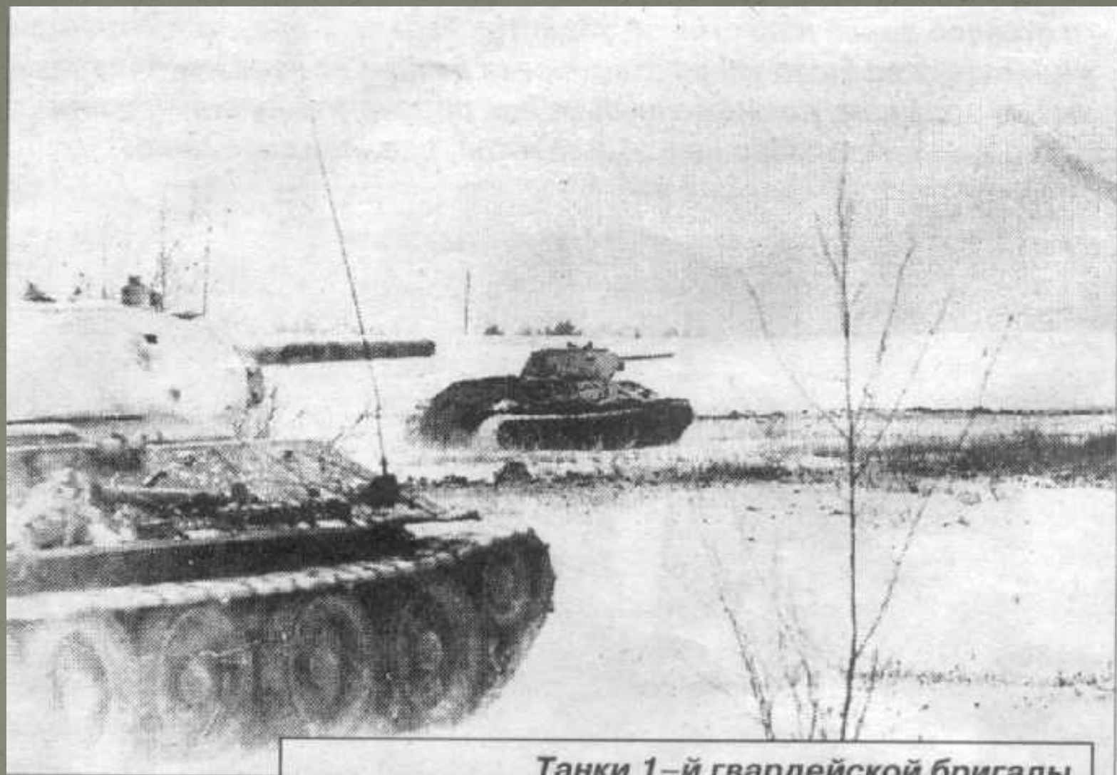
Танки 1-й гвардейской бригады полковника М. Катукова идут в атаку на врага (автор фото не установлен, 1941 год)