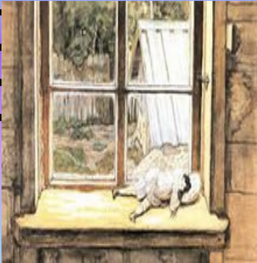
Степан Добужинский 1905 год « КУКЛА »