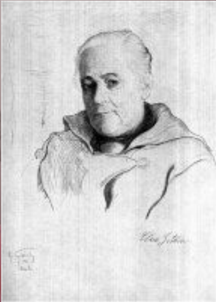
Клара Цеткин (Рисунок художника И. Бродского)