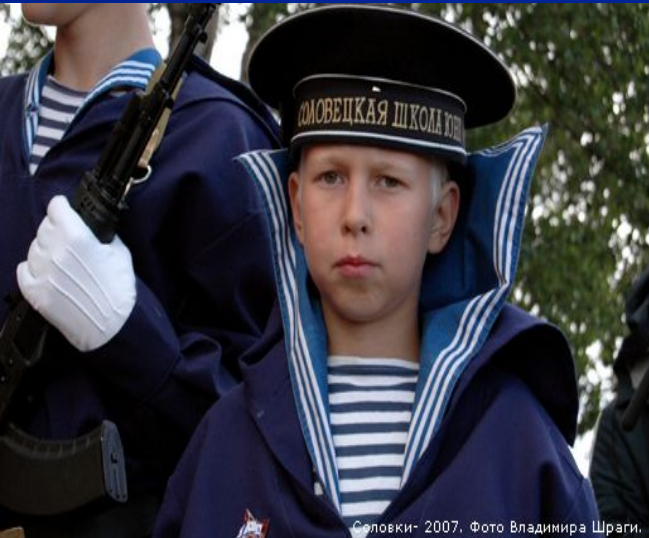
Соловки- 2007.