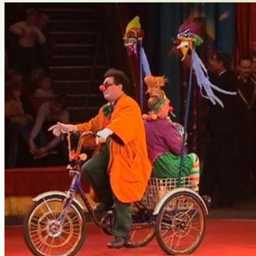
Клоуны в цирке разгонят тоску.