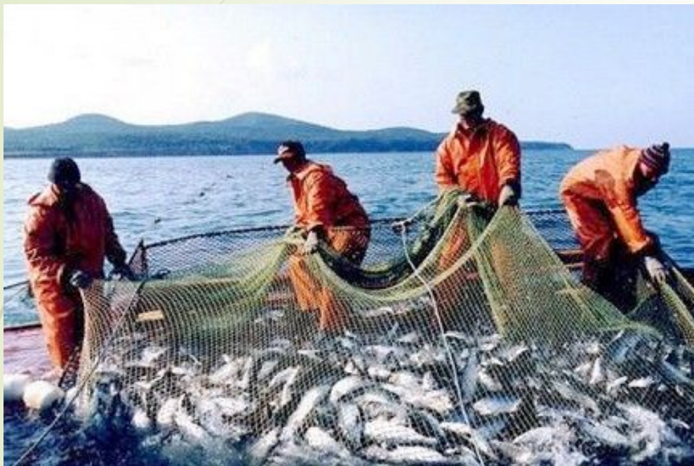
Ловит рыбак судака и треску,