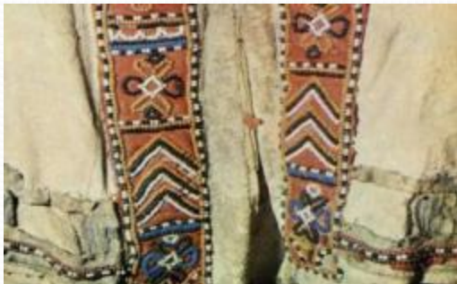
Вышивка оленьим волосом