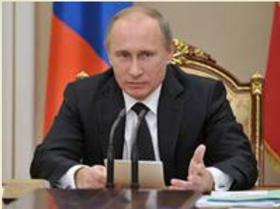
Путин Владимир Владимирович президент России