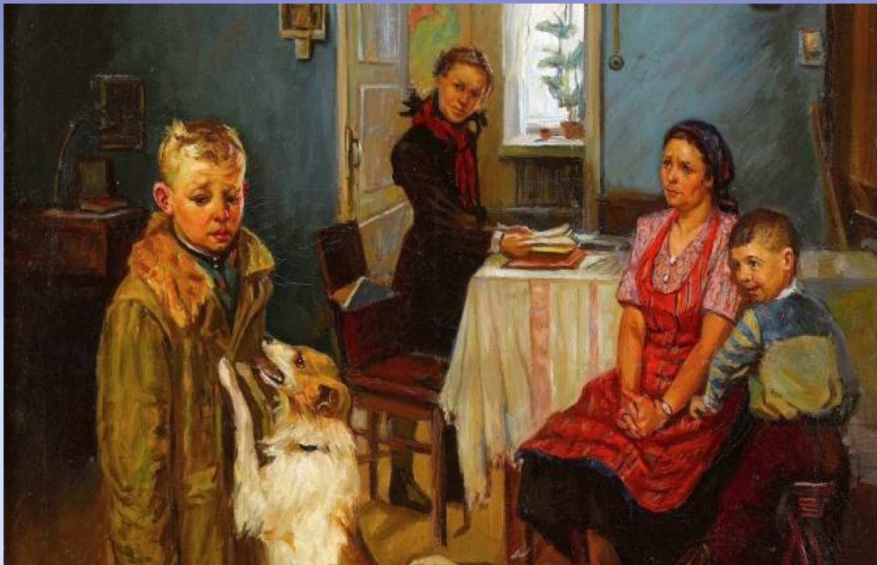
Решетников Ф.П. Опять двойка