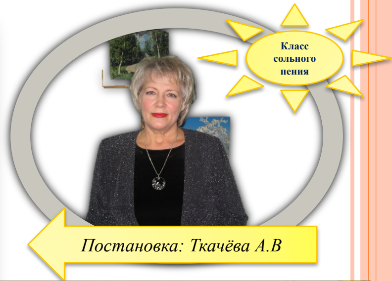
Постановка: Ткачёва А.В.