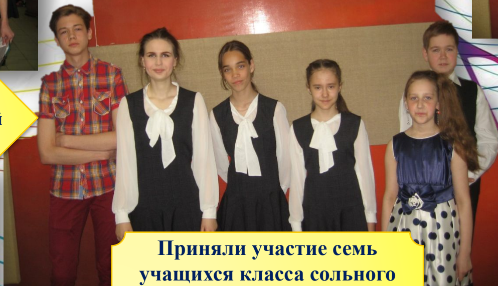
Приняли участие семь учащихся класса сольного пения