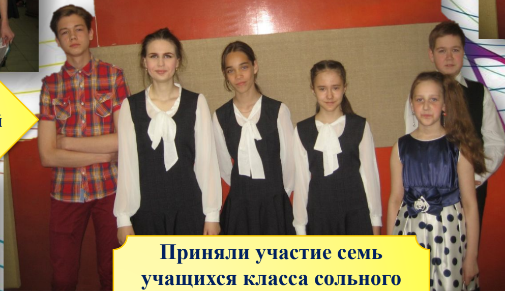
Приняли участие семь учащихся класса сольного пения