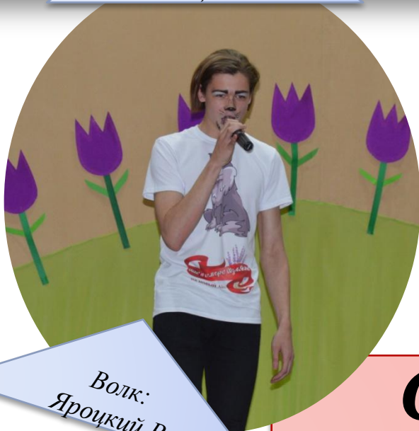
Волк: Яроцкий В.