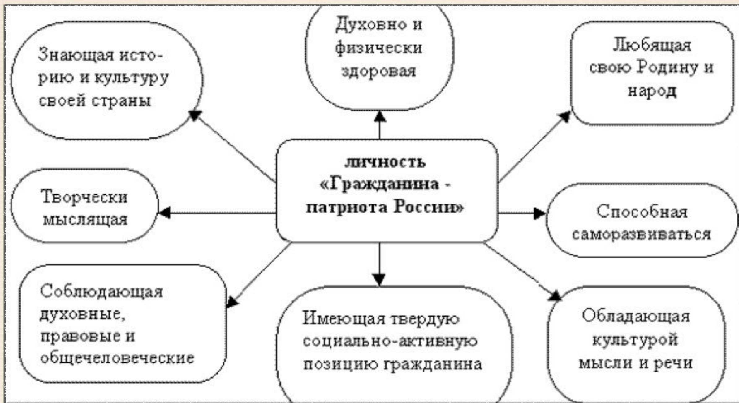
Модель личности «Гражданина - патриота России»