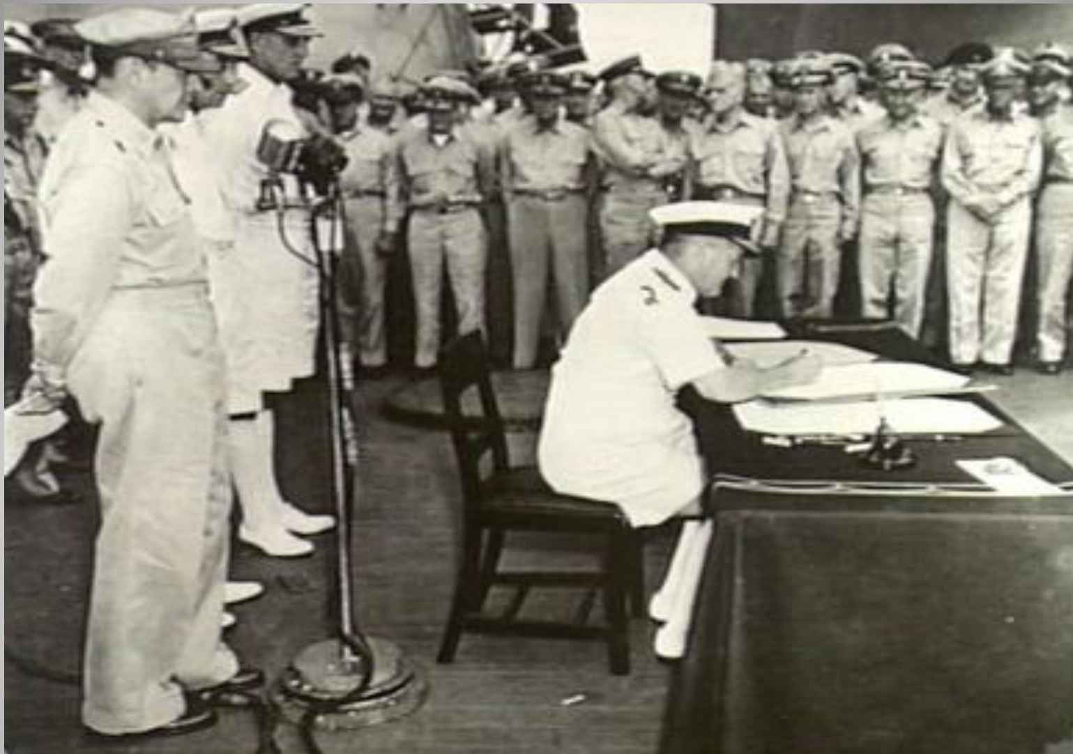
Командующий британским Тихоокеанским флотом Брюс Фрэзер Брюс Фразэр