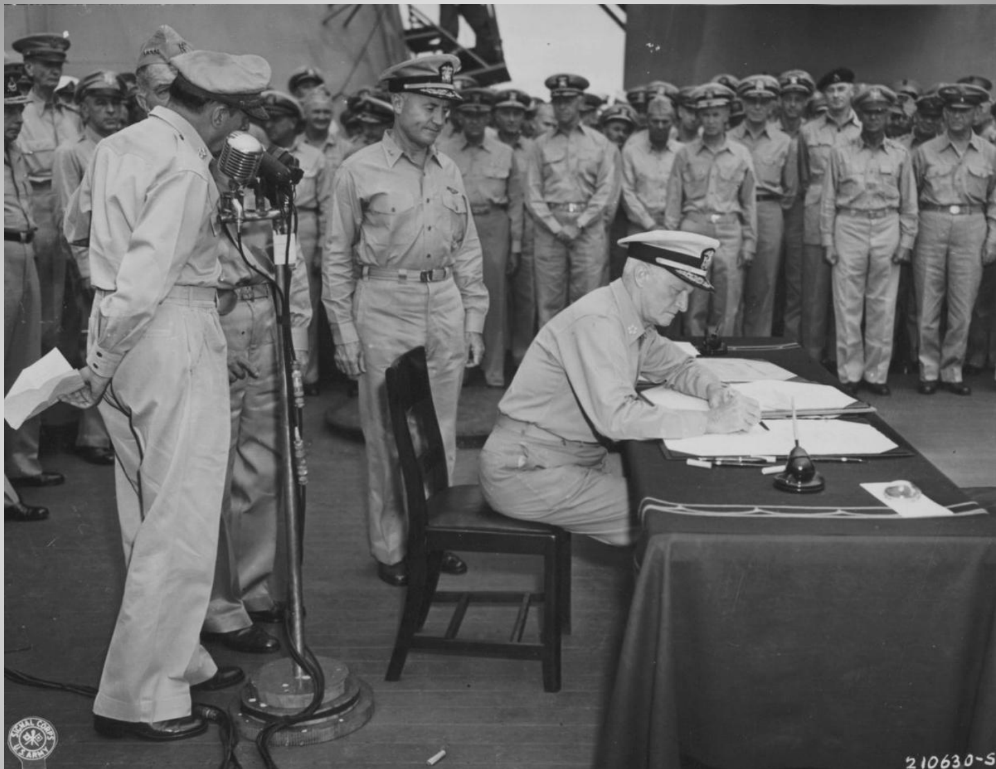
Главком Тихоокеанского флота США, адмирал Честер Нимиц