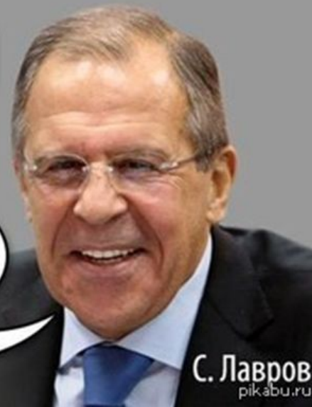
С. Лавров