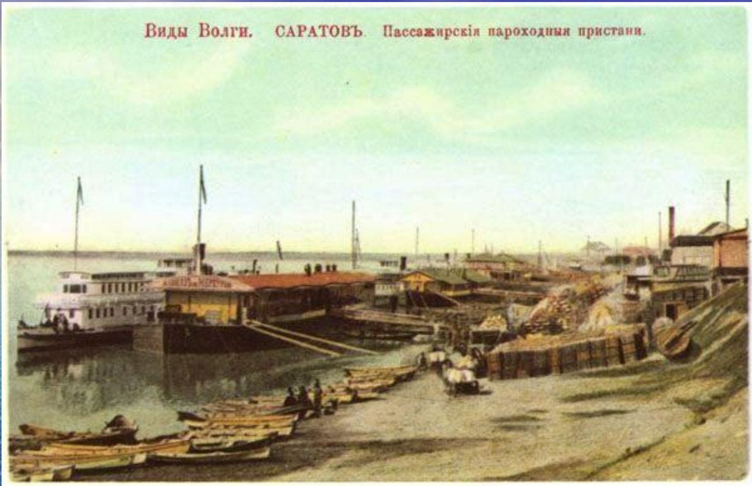
Виды Волги. САРАТОВЪ. Пассажи́рскія пароходныя пристани.

Зимой 1613 года в Саратове случился пожар, город полностью уничтожен и вновь отстроен на левом берегу Волги. В 1670 году Степан Разин подверг город трехдневному грабежу. Весной 1674 года по указу царя город переносят на правый берег реки Волги.