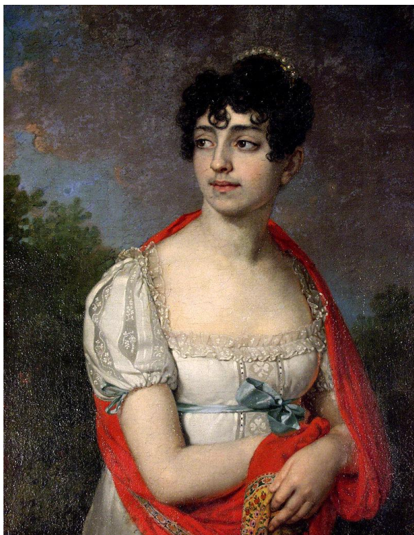
Княгиня Мария Барятинская, чьим именем названа Усадьба.