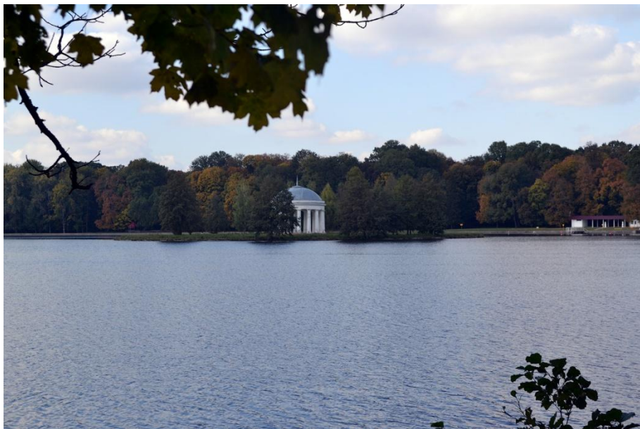
Большой Марьинский пруд