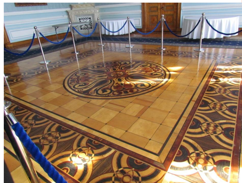
Дореволюционный паркет который сохранился до наших дней