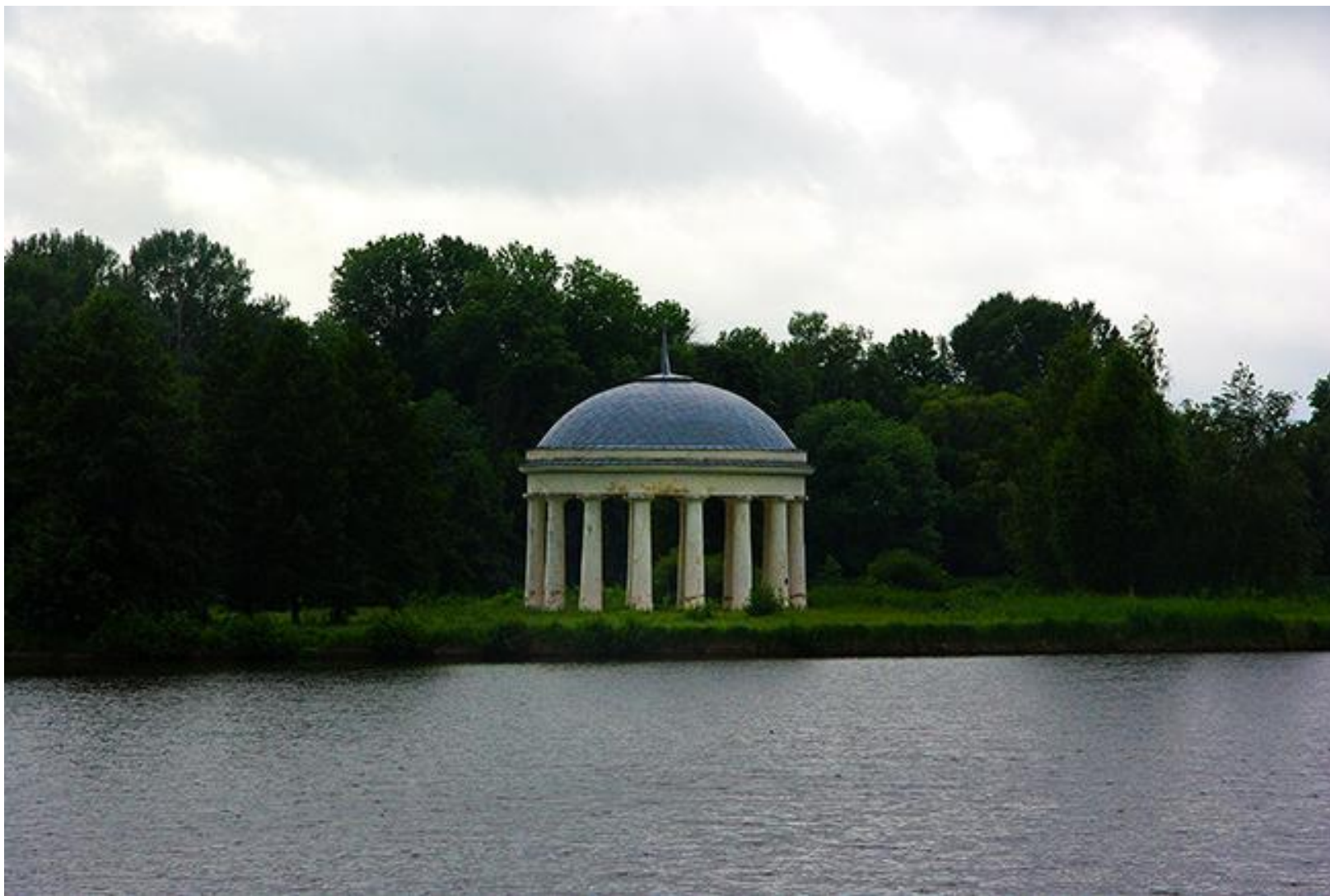
Шестнадцатиколонная ротонда под сферическим куполом