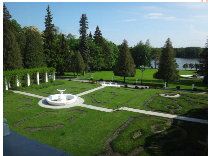
Парк с регулярной частью при дворце