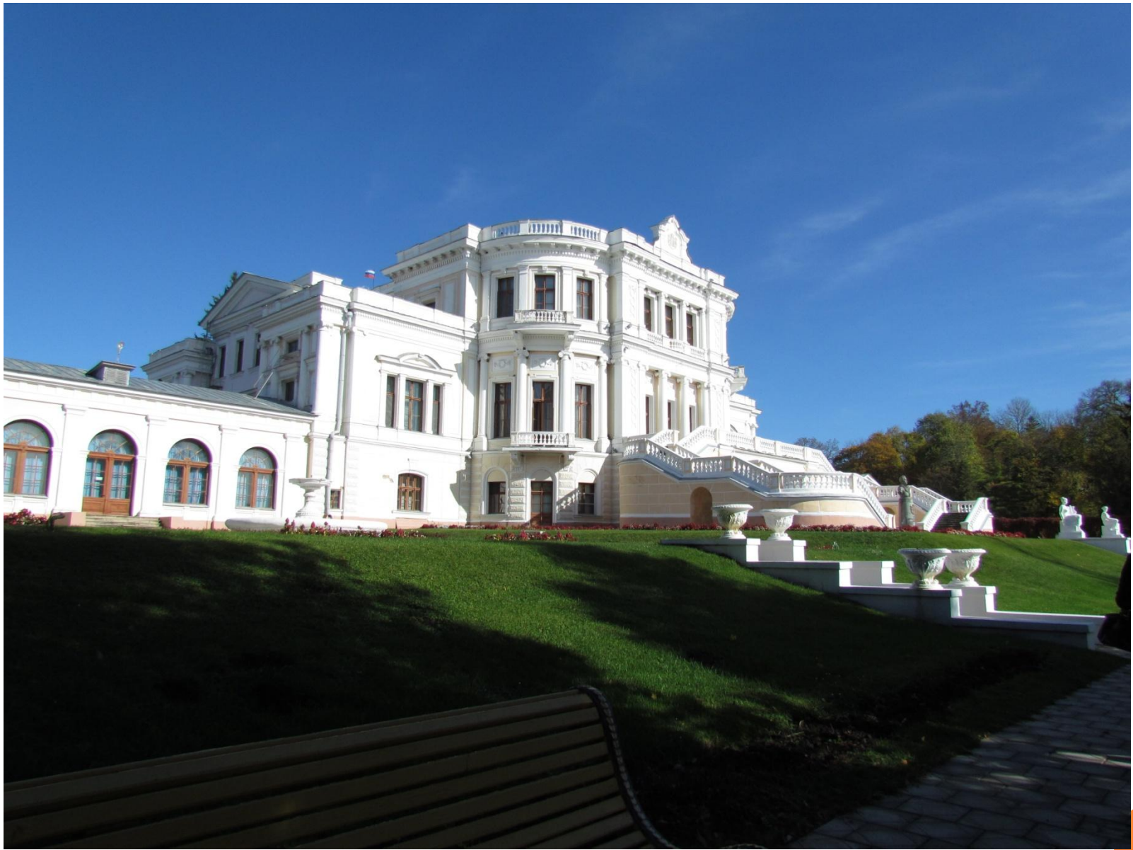
Марьинский дворец в современности