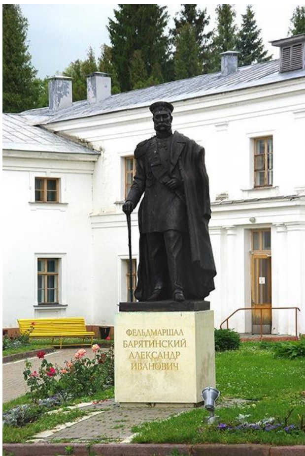
Памятник фельдмаршалу Александру Барятинскому