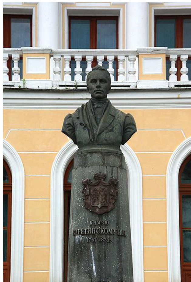
Памятник И. И. Барятинскому