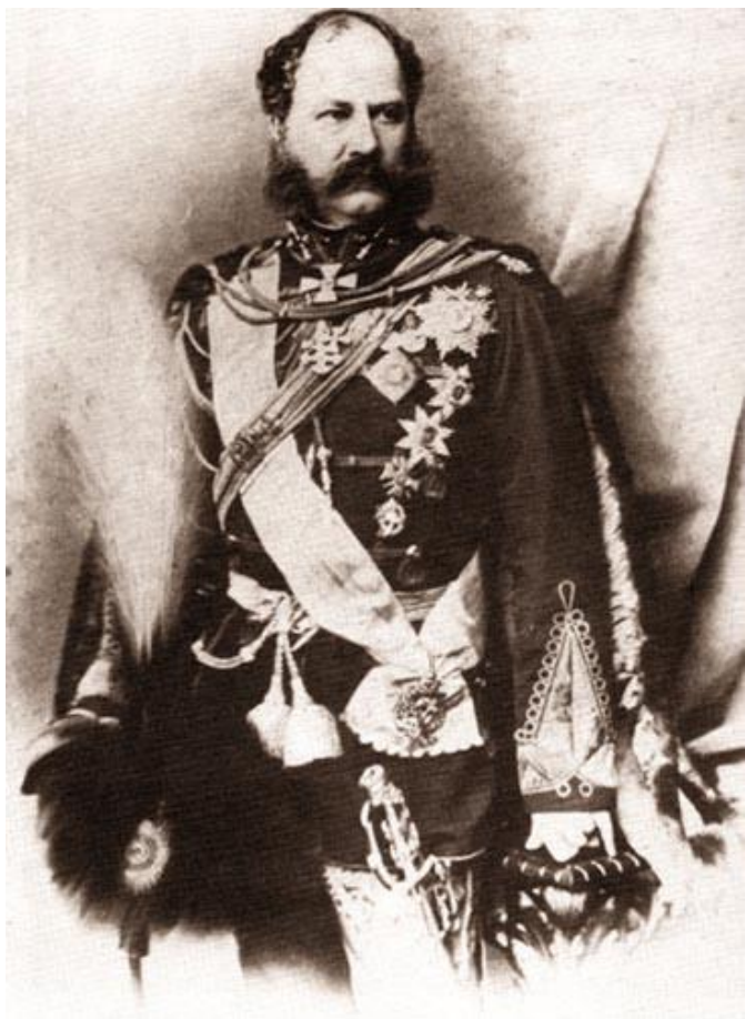
Александр Иванович Барятинский (1815-1879)