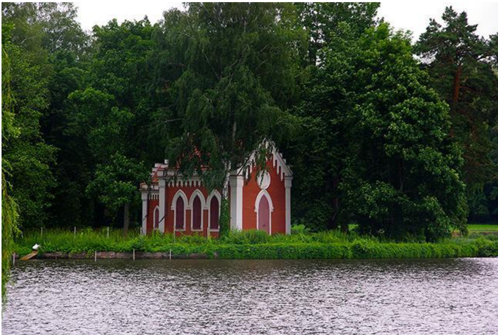
Миниатюрная лютеранская кирха