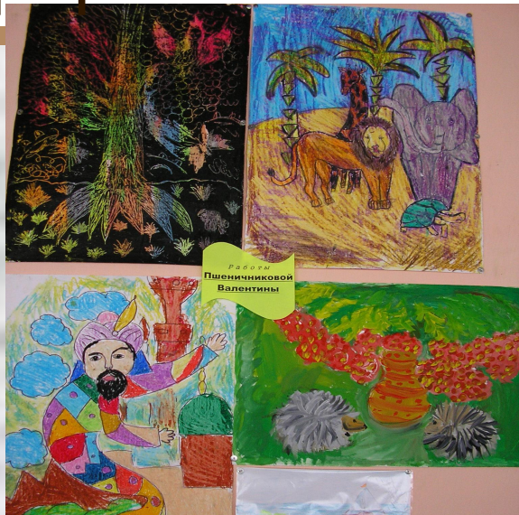
Работы Пшеничковой Валентины