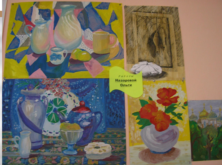
Работы Назаровой Ольги