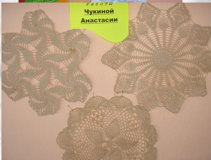
Работы Чукиной Анастасии