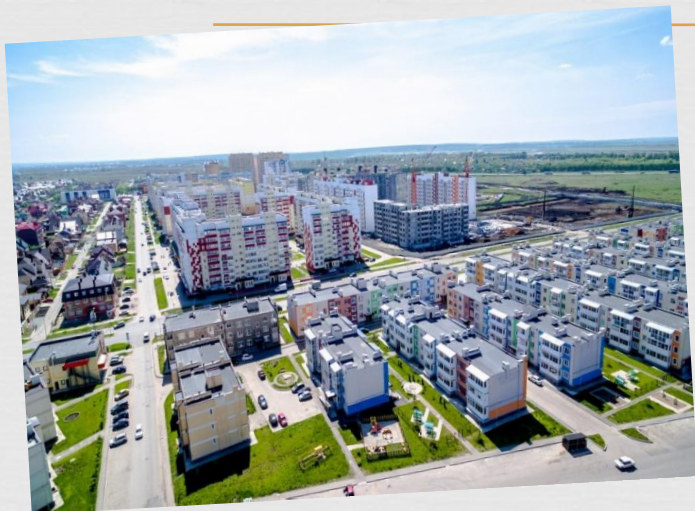
Запад - 1