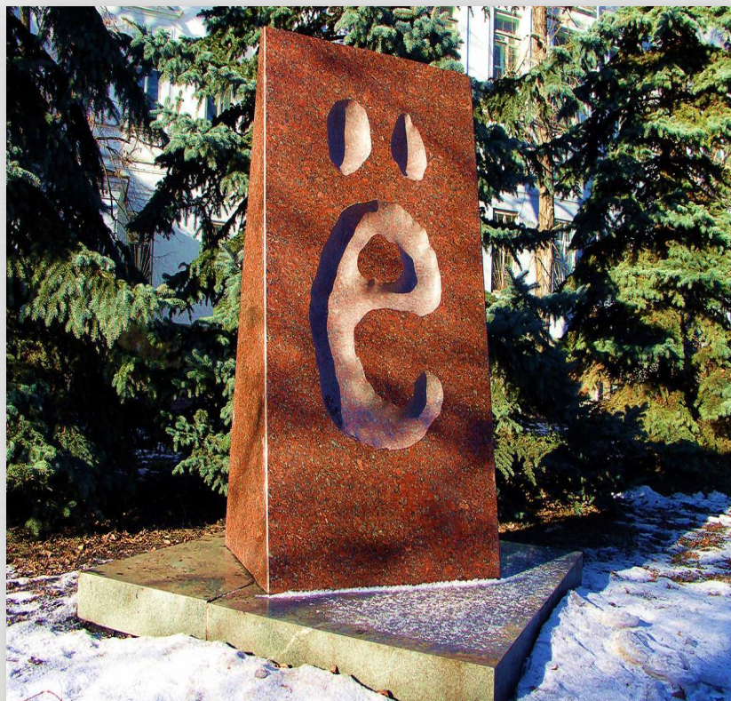
Памятник букве «Ё»

Городские власти увековечили в красном граните спорную букву русского алфавита, которую изобрел в письменном виде Николай Карамзин. Именно в этом оригинальном написании и изображена она на современном памятнике. Памятник симбирциту или волжскому янтарю В 1765 году открыто уникальное месторождение древнейшего камня симбирцита или волжского янтаря. Памятник установлен в 2005 году.