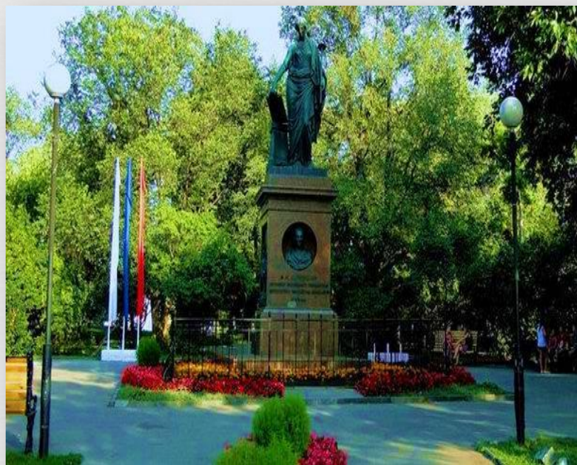
Сквер Н.М. Карамзина

Сквер Н.М.Карамзина расположен в исторической части города и является привлекательным местом для отдыха и прогулок. Главной частью сквера является памятник Карамзину. Он был воздвигнут в 1844 году и до сих пор своей красотой, оригинальностью привлекает к себе внимание. Памятник состоит из меди и гранитной основы.