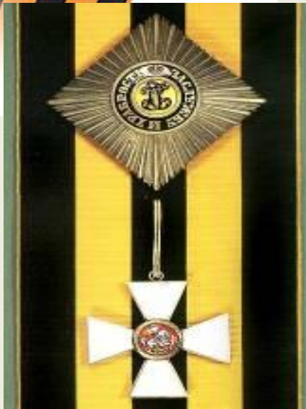
Знак 2-й степени