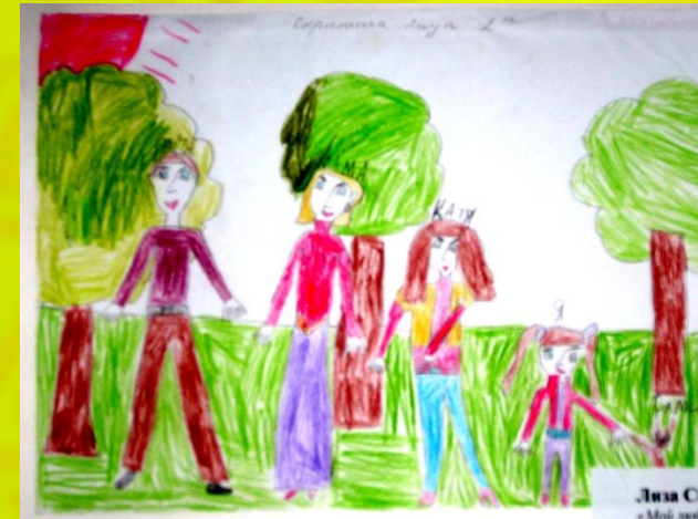
Лиза С «Мой л