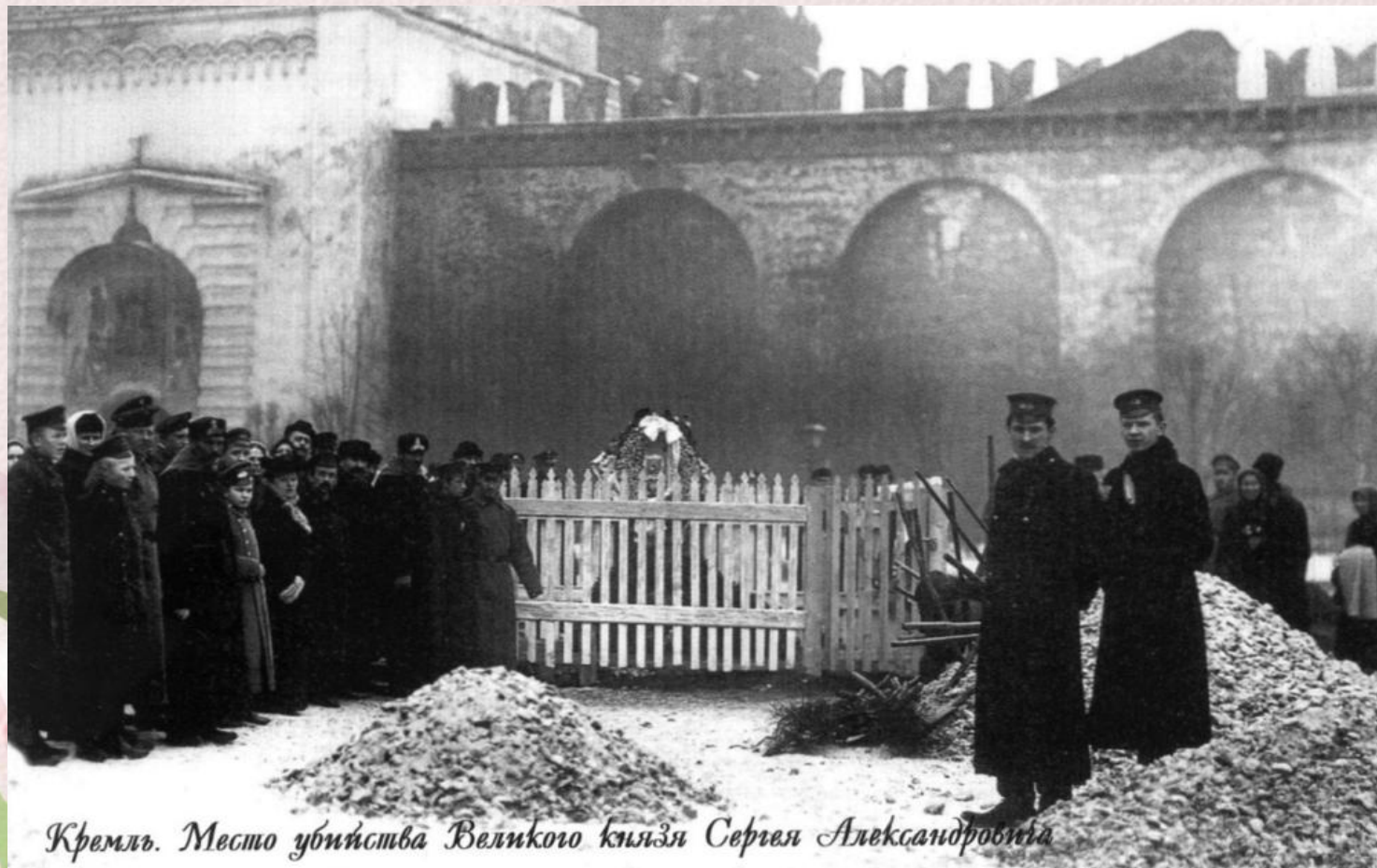
Кремль. Место убийства Великого князя Сергея Александровича

5 (18) февраля 1905 года Сергей Александрович был убит бомбой, брошенной террористом Иваном Каляевым