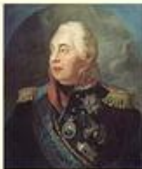
Михаил Илларионович Кутузов