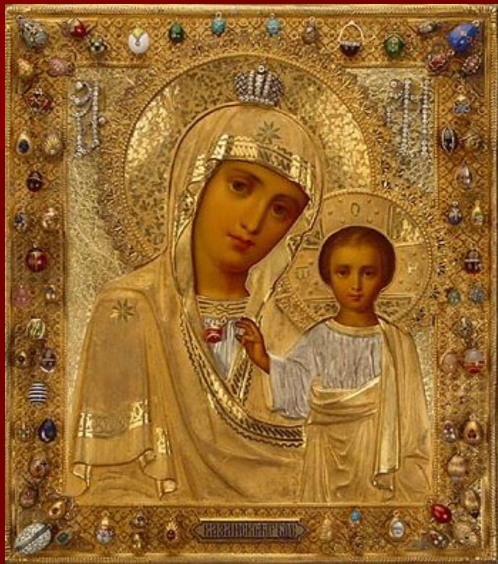
Казанская Божья Матерь XVI век