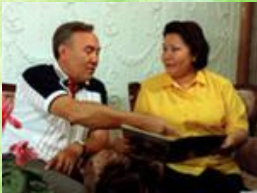
Родители Назарбаева Н.А.