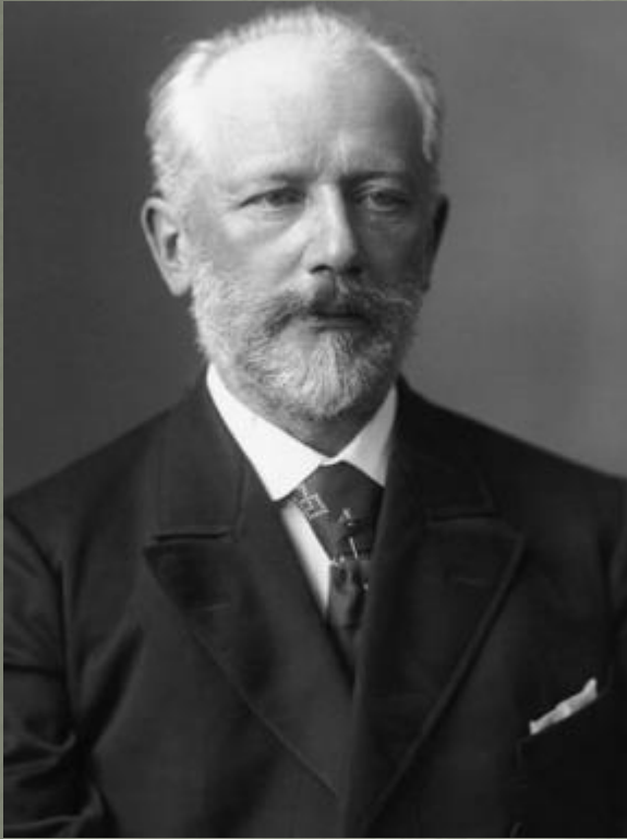
П. И. Чайковский