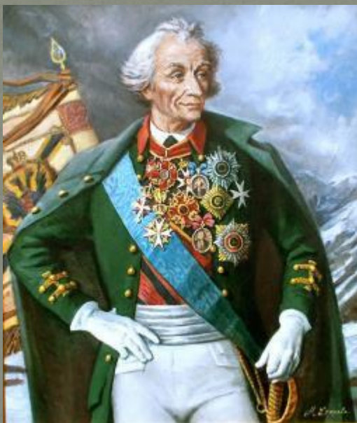
А. В. Суворов