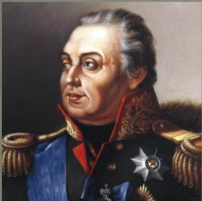
М. И. Кутузов