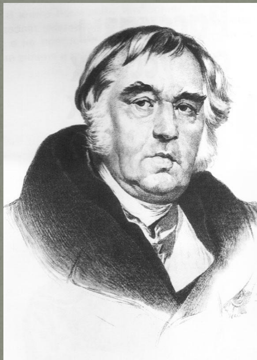
И. А. Крылов