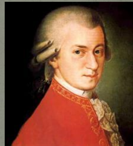
М. Ю. Лермонтов