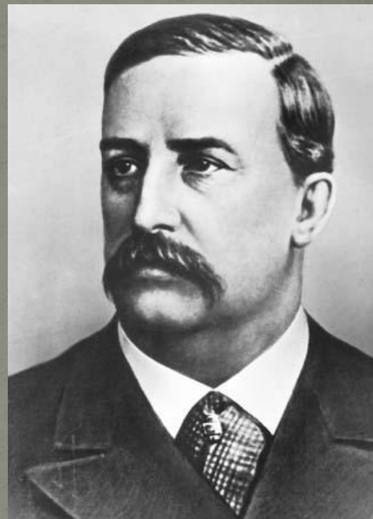
А. С. Пушкин