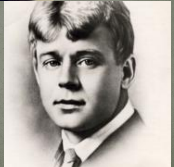
С. А. Есенин