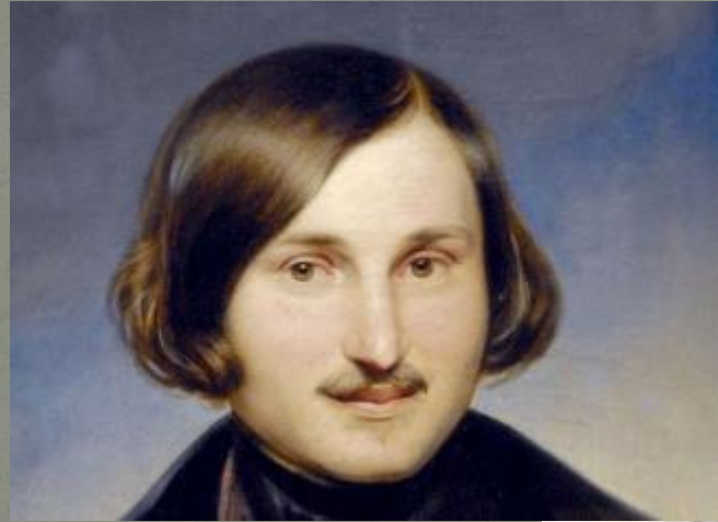
Н. В. Гоголь