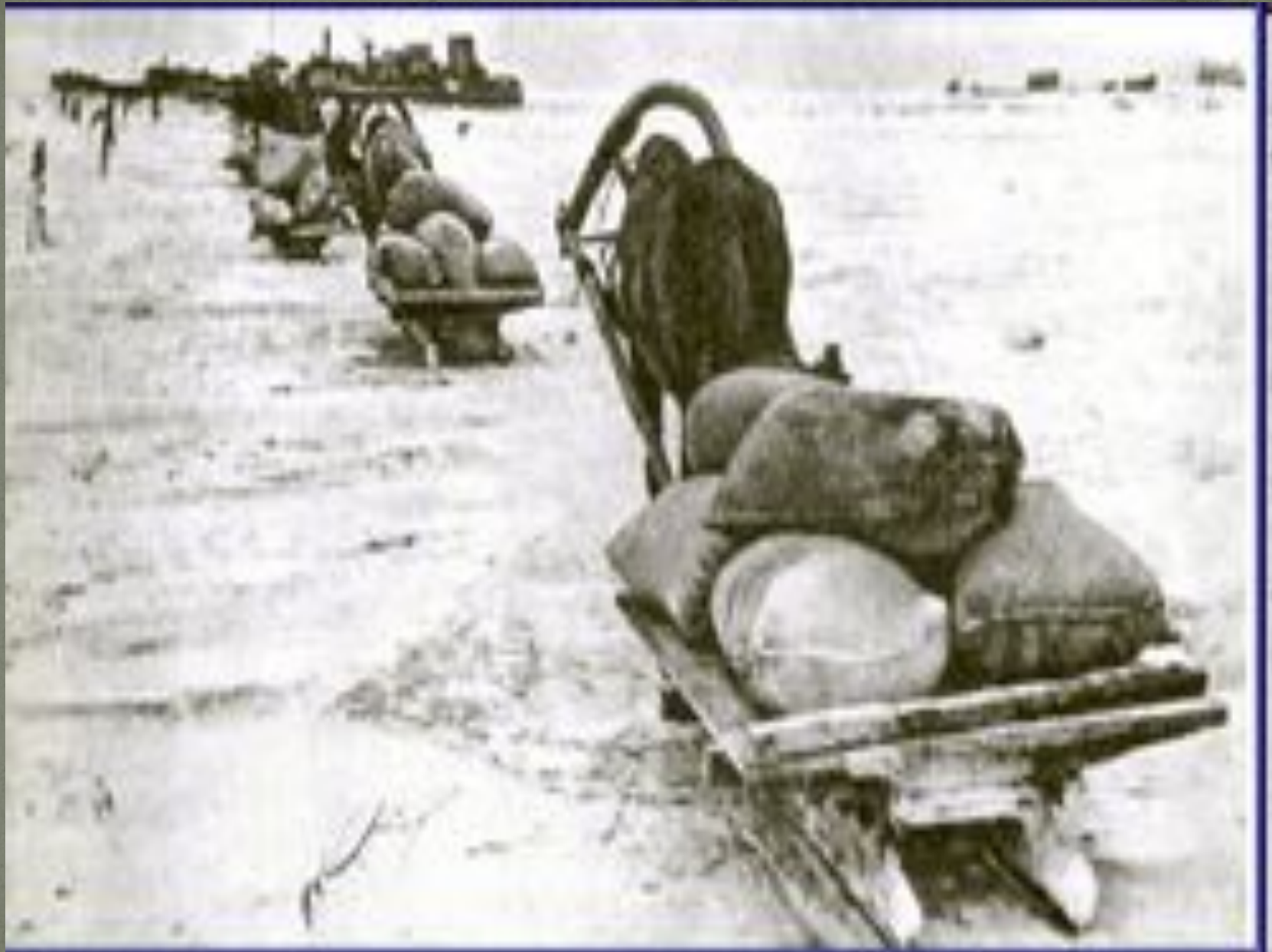
Первыми по ней пошли конные обозы с хлебом.