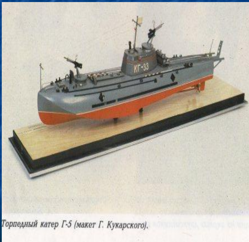
Торпедный катер Г-5 (макет Г. Кукарского).