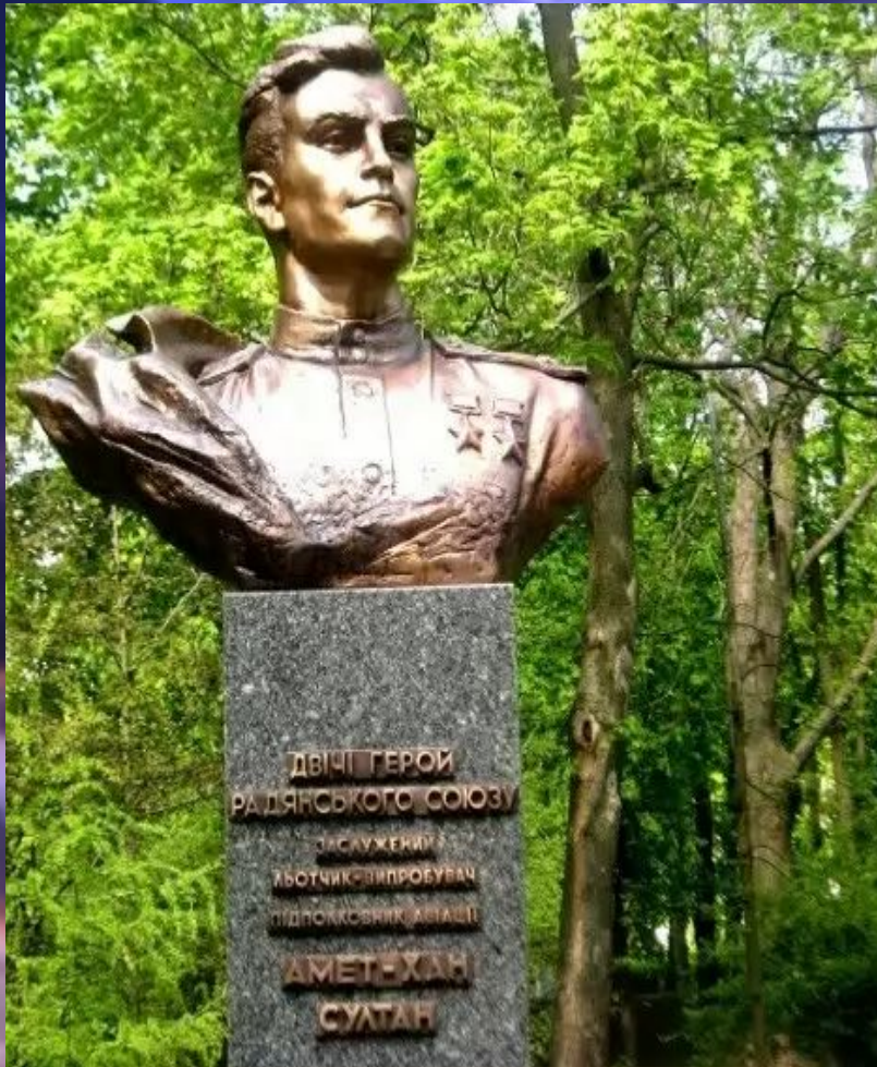
Памятник Амет-Хану Султану на Аллее героев в Киеве.