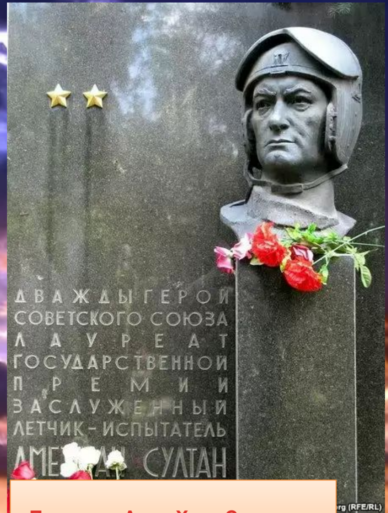
Памятник Амет-Хану Султану в Симферополе.