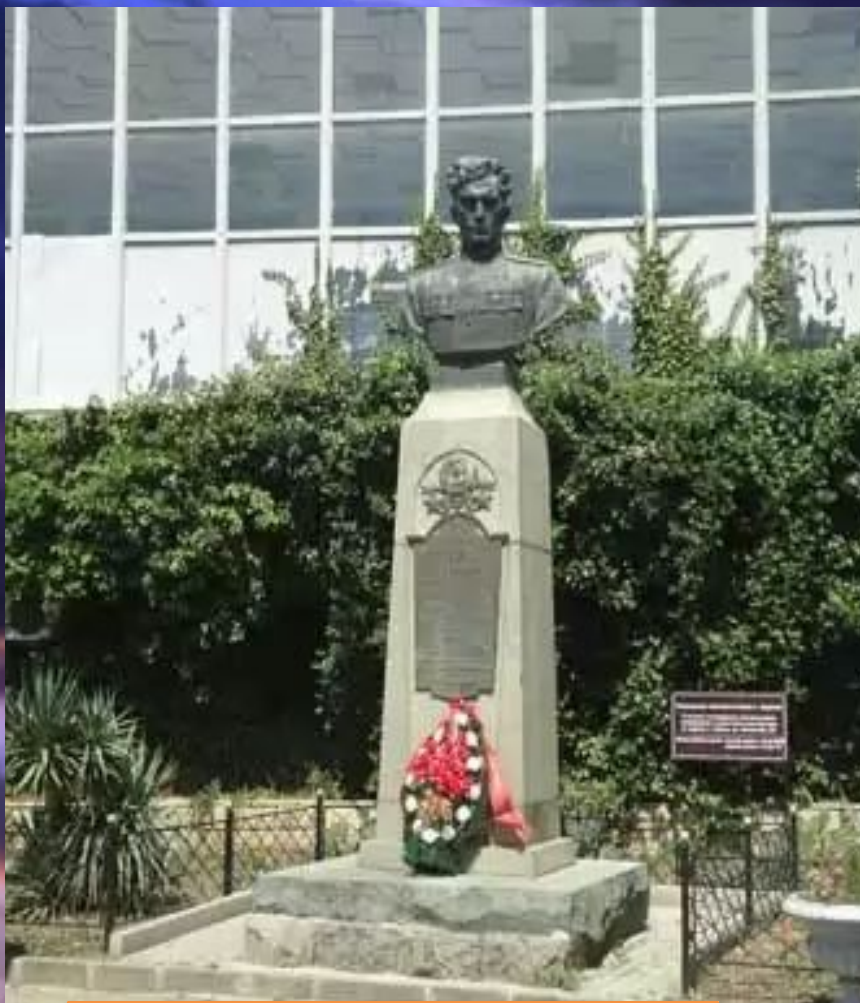
Памятник Амет-Хану Султану в родном городе Алушке.