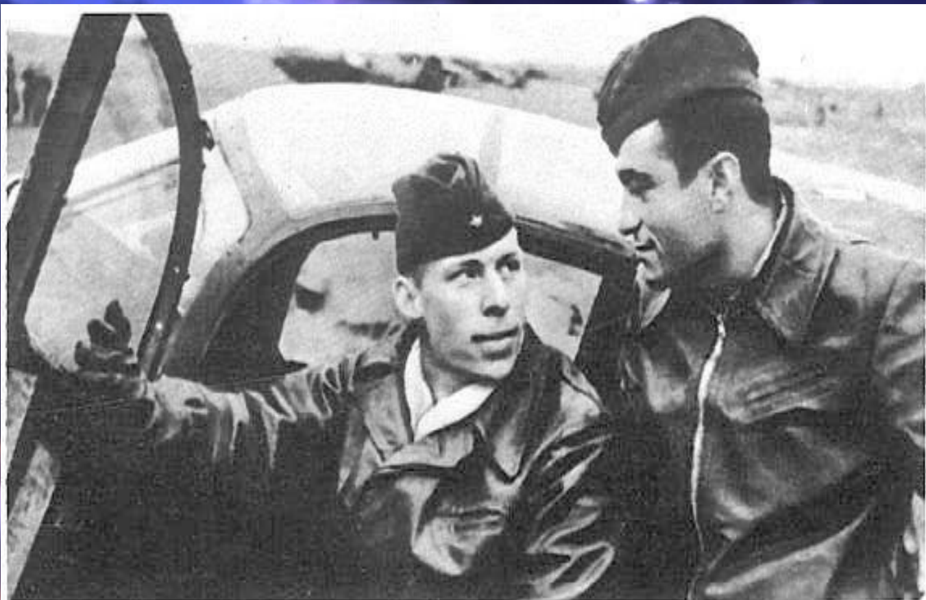
Командиры эскадрилий 9-го гвардейского истребительного авиаполка дважды Герой Советского Союза капитан А. В. Алелюхин (слева) и Герой Советского Союза капитан С. Амет-хан (в 1945 году награжден второй медалью «Золотая Звезда»)