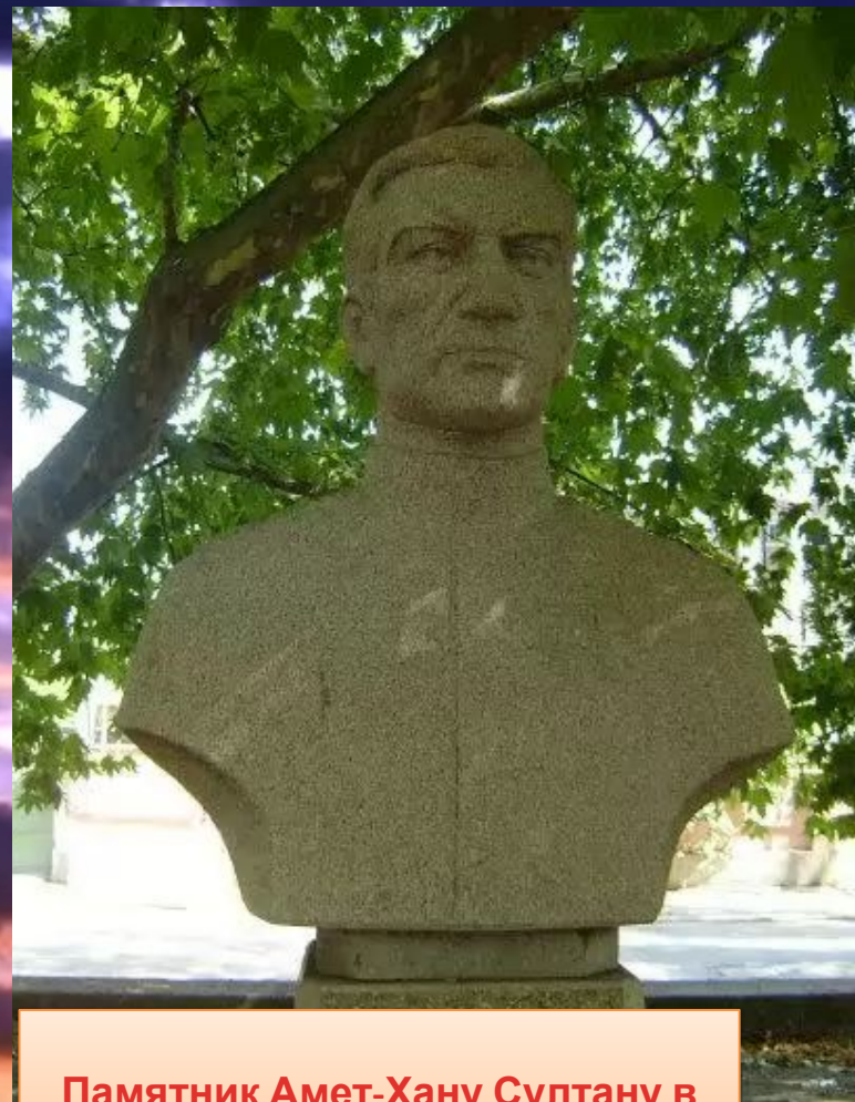
Памятник Амет-Хану Султану в Феодосии.