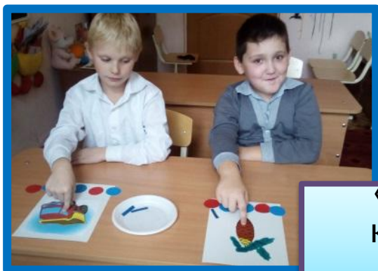
«Подбери картинку к схеме»