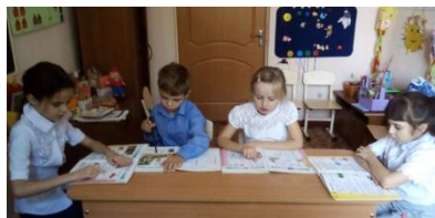
«У кого больше слов?»