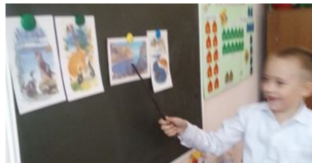
Составление рассказа по плану