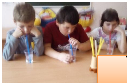
Упр. «Буря в стакане»