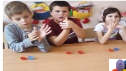
Массаж рук Су Джоком