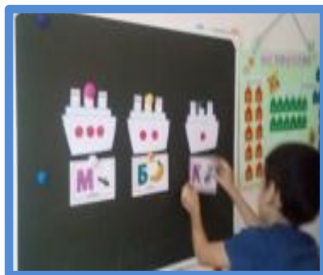
Слог — слово — звук»