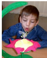
Носом правильно дышу говорить скорей хочу