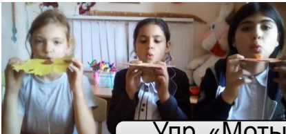
Упр. «Мотылек лети!»