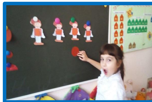
Упр. «Найди звук»