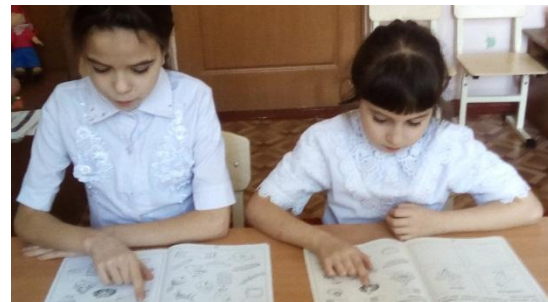
Упр «.СЛОВА – РОДСТВЕННИКИ»