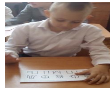
Упр.» ИСПРАВЬ ОШИБКУ»