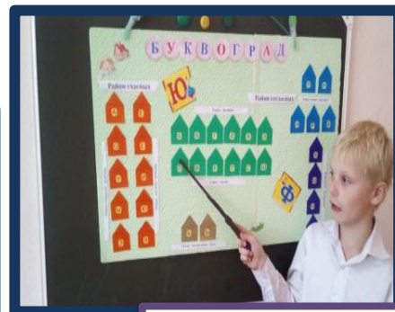
Путешествие по Буквограду