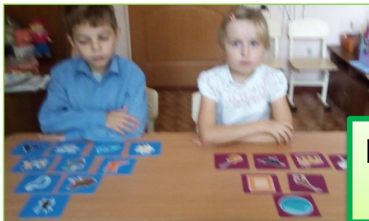
Игра «Цепочка СЛОВ»