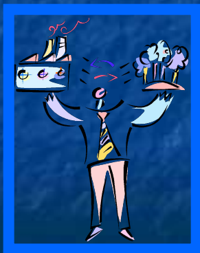
Ответственность перед обществом и людьми