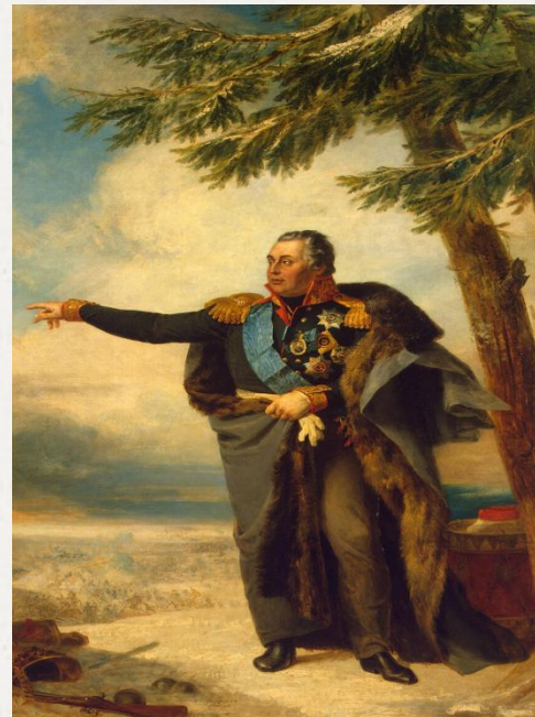
Михаил Кутузов Художники Дж. Доу, А.Поляков, В.Голике

Михаи́л Илларио́нович Голени́щев-Куту́зов (светле́йший князь Голени́щев-Куту́зов- Смоле́нский, 1745—1813) — прославленный русский полководец, генерал-фельдмаршал (с 1812), светлейший князь (с 1812). Герой Отечественной войны 1812 года.