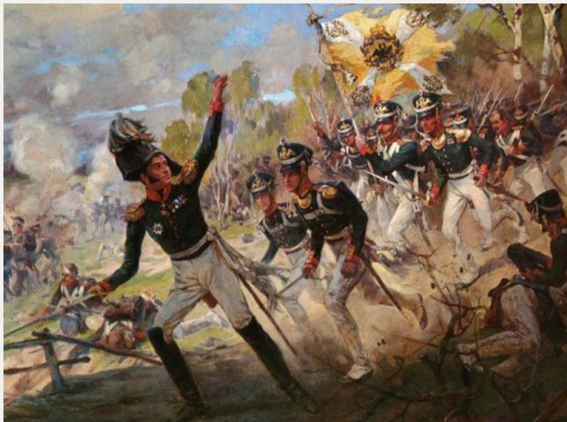
Подвиг солдат Раевского под Салтановкой 11 июля 1812 года.