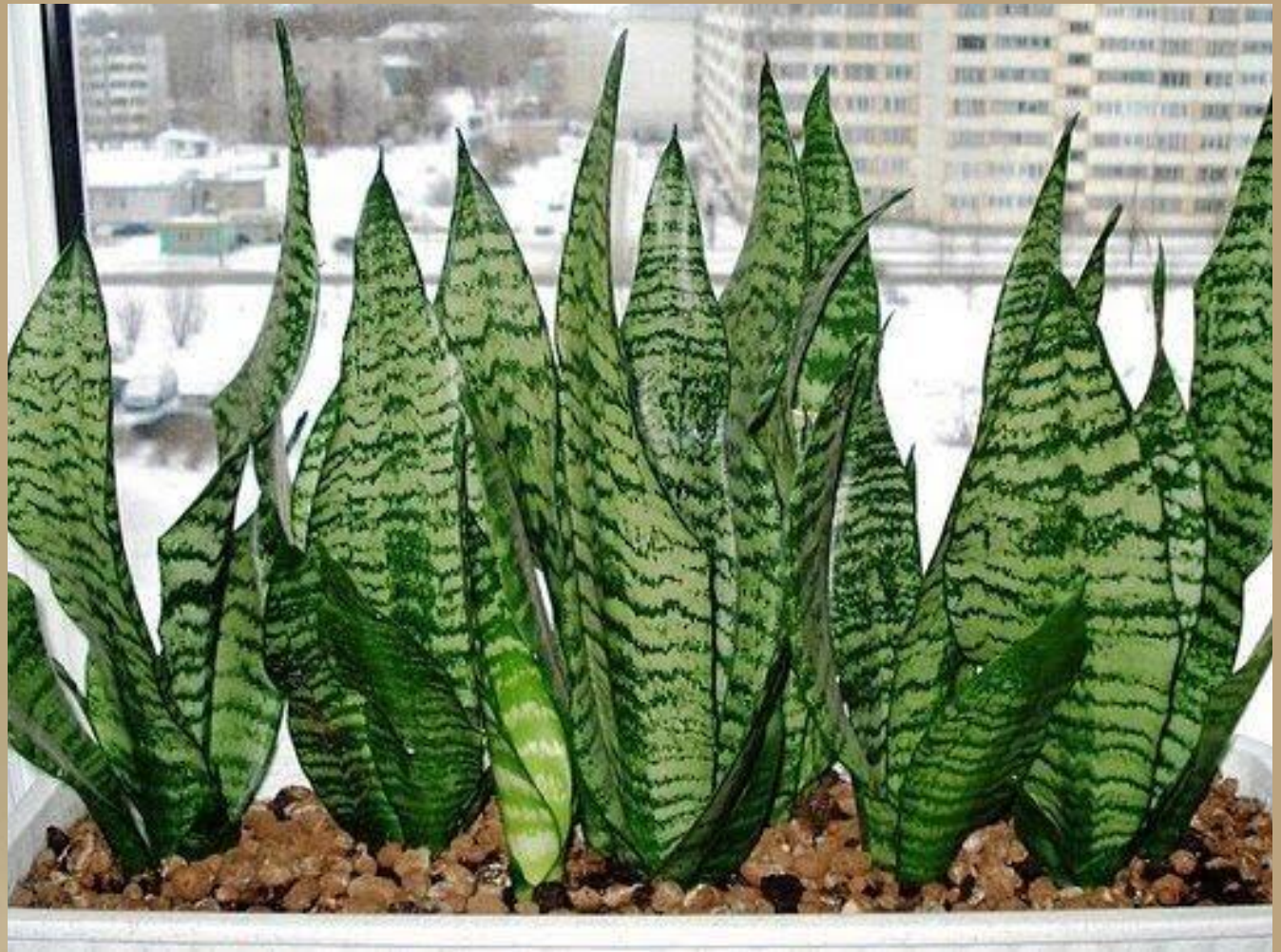
Сансевиерия (щучий хвост)