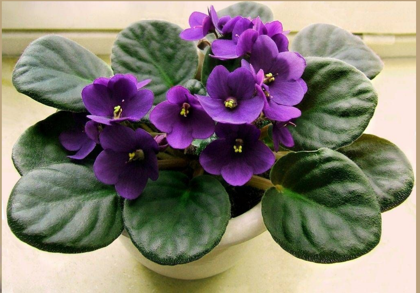
Фиалка узумбарская (сентполия)