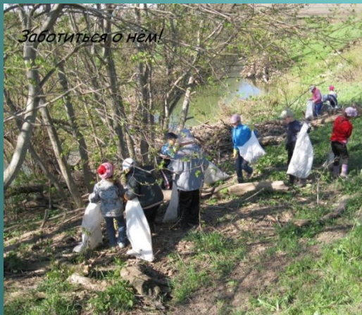
Забитися о нем!