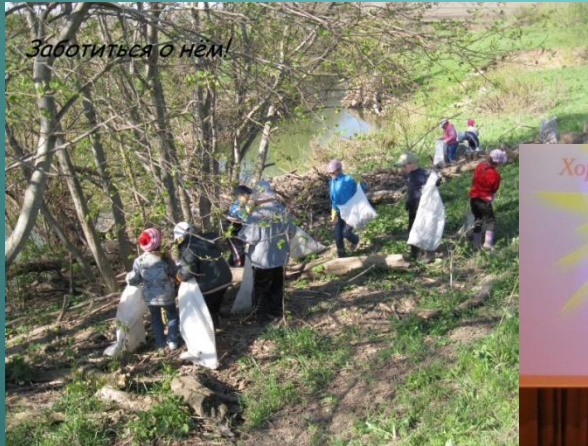
Забитесь о нем!