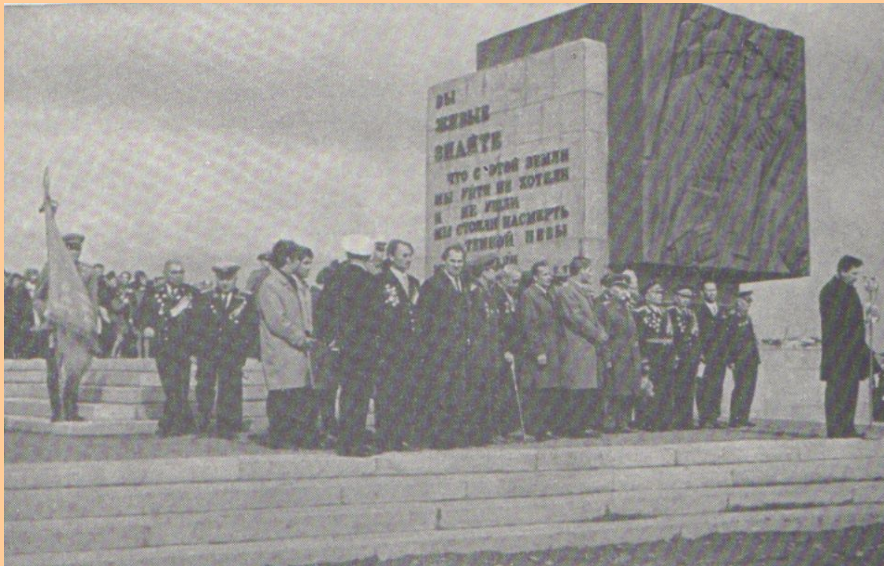
Легендарный Невский «пяточок»