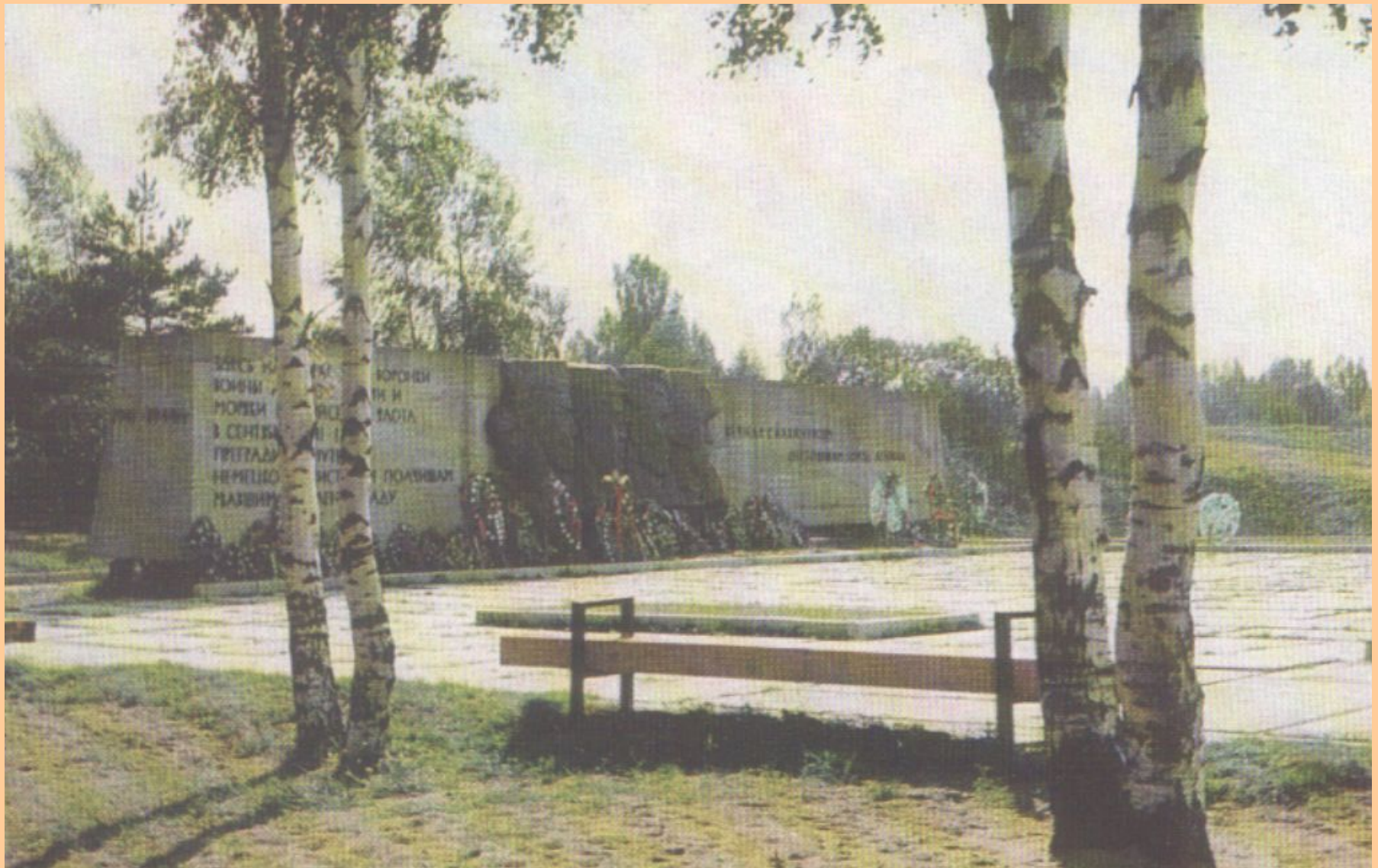
Мемориальный комплекс «Берег мужественных»