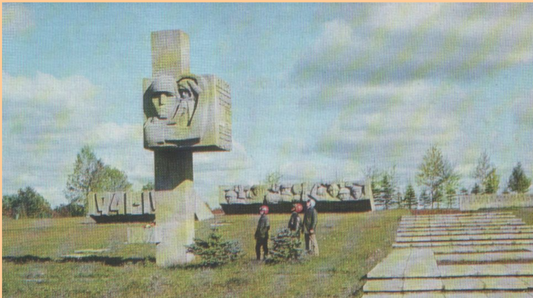
Мемориальный комплекс «Лемболовская твердыня»