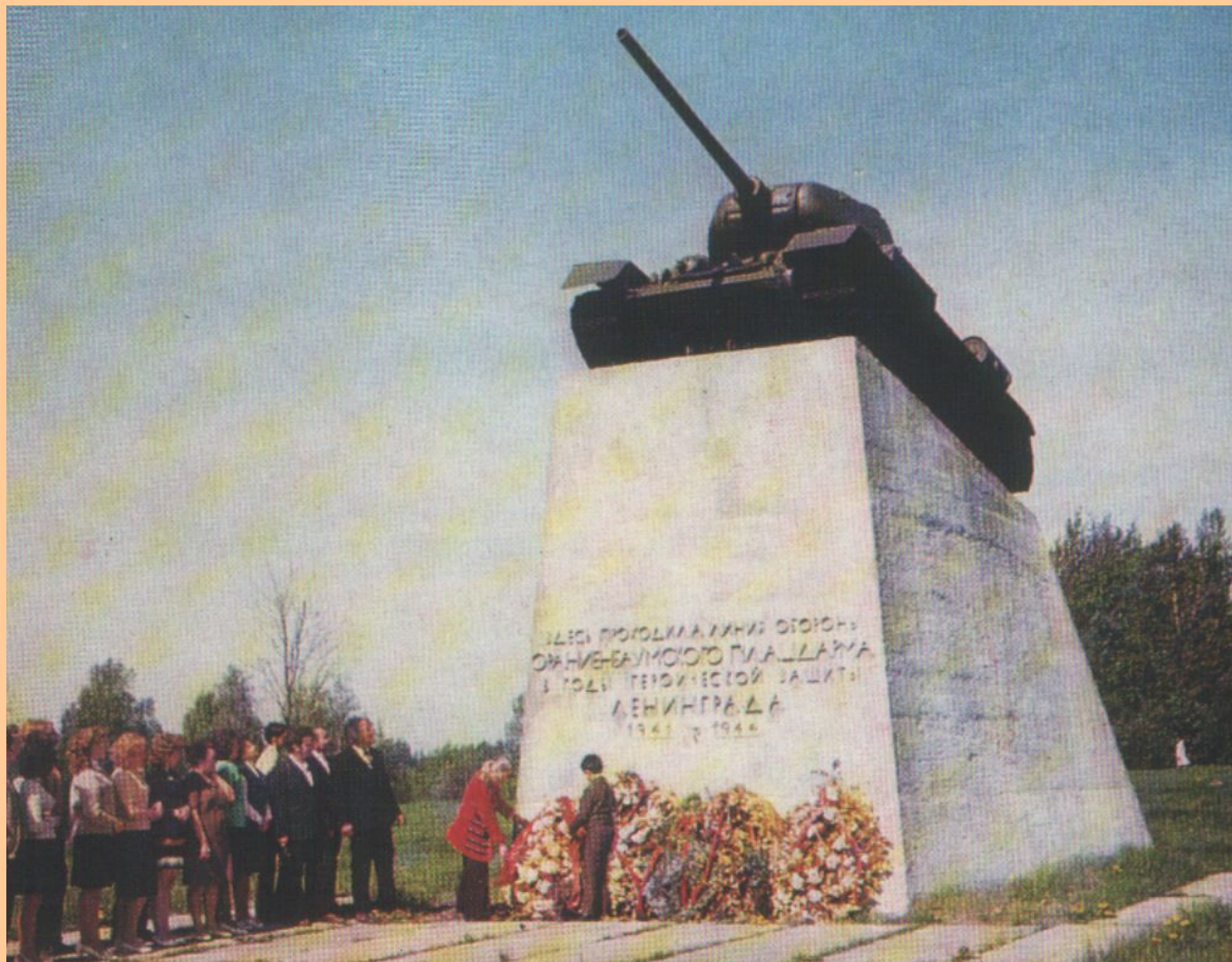
Памятник «Атака» на бывшей линии обороны Ораниенбаумского плацдарма.