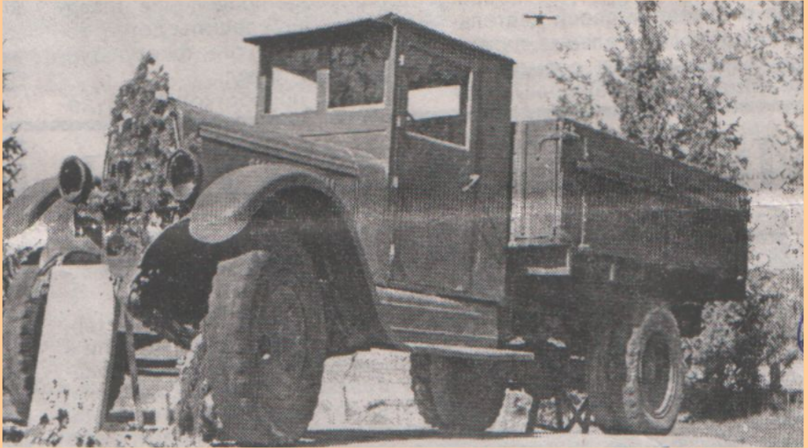
Автомобиль «ЗИС-5» в пос. Подборовье