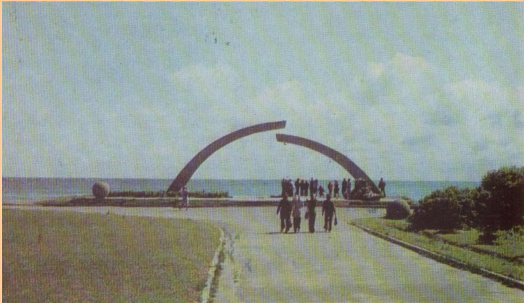
Памятник «Разорванное кольцо»