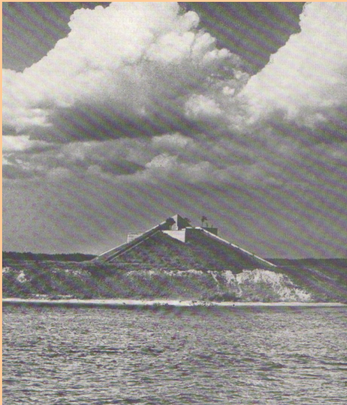
Памятник «Безымянная высота» на правом берегу Невы