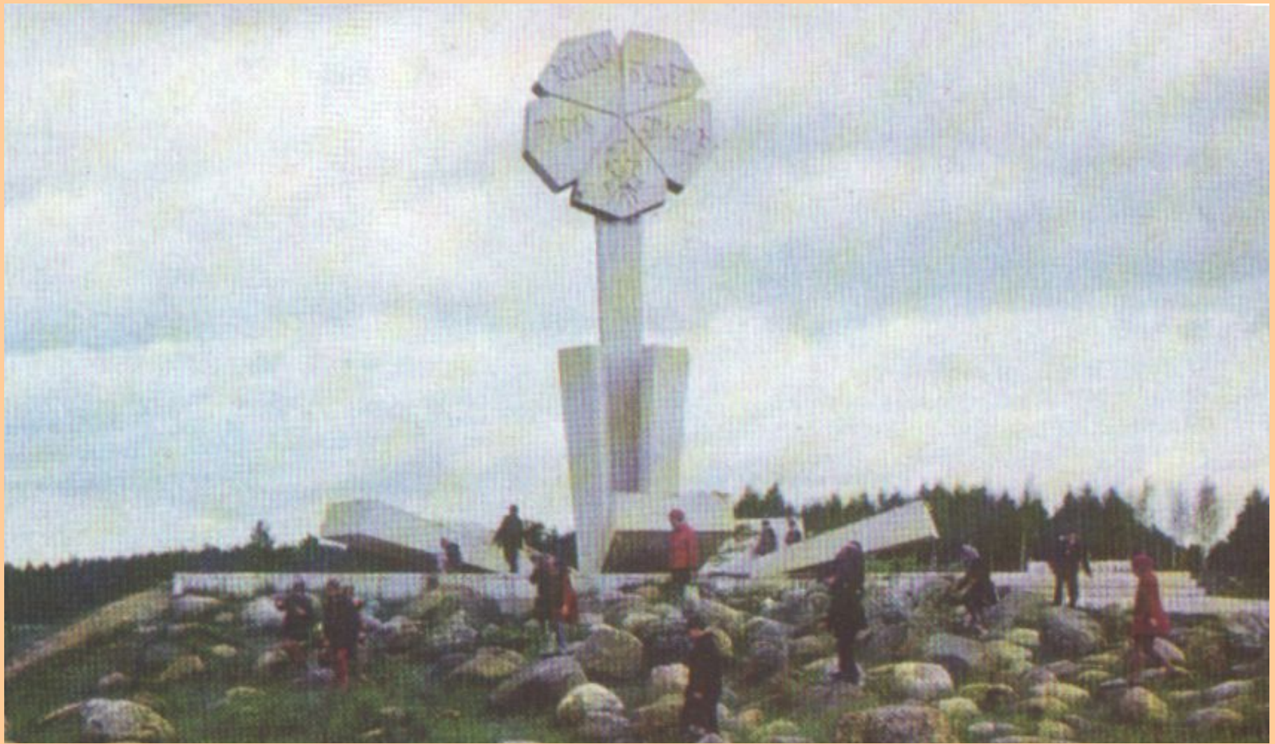
Памятник «Цветок жизни» на 3-м км Рябовского шоссе, посвященный детям героического Ленинграда.