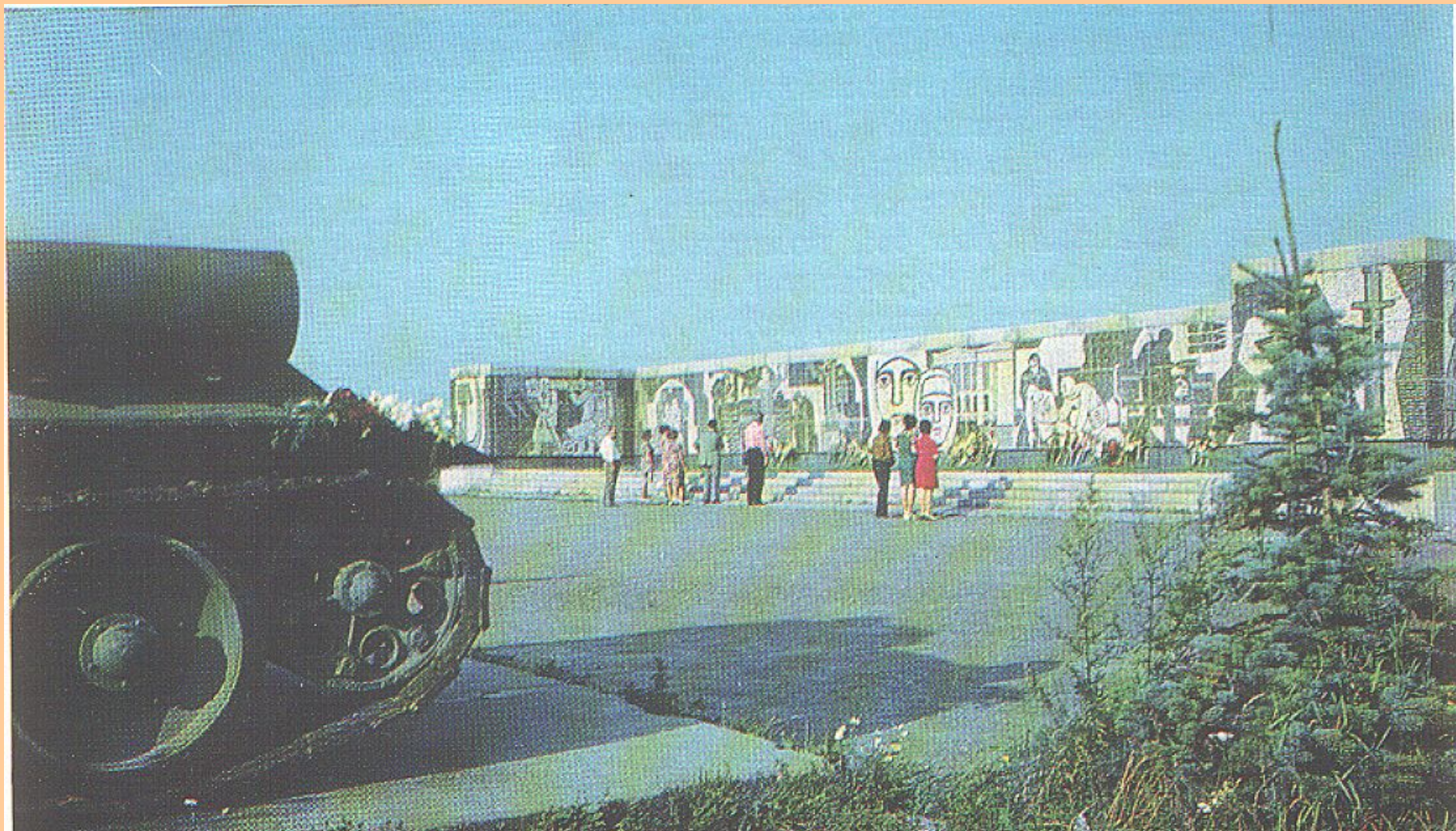
Мемориальный комплекс «Пулковский рубеж»