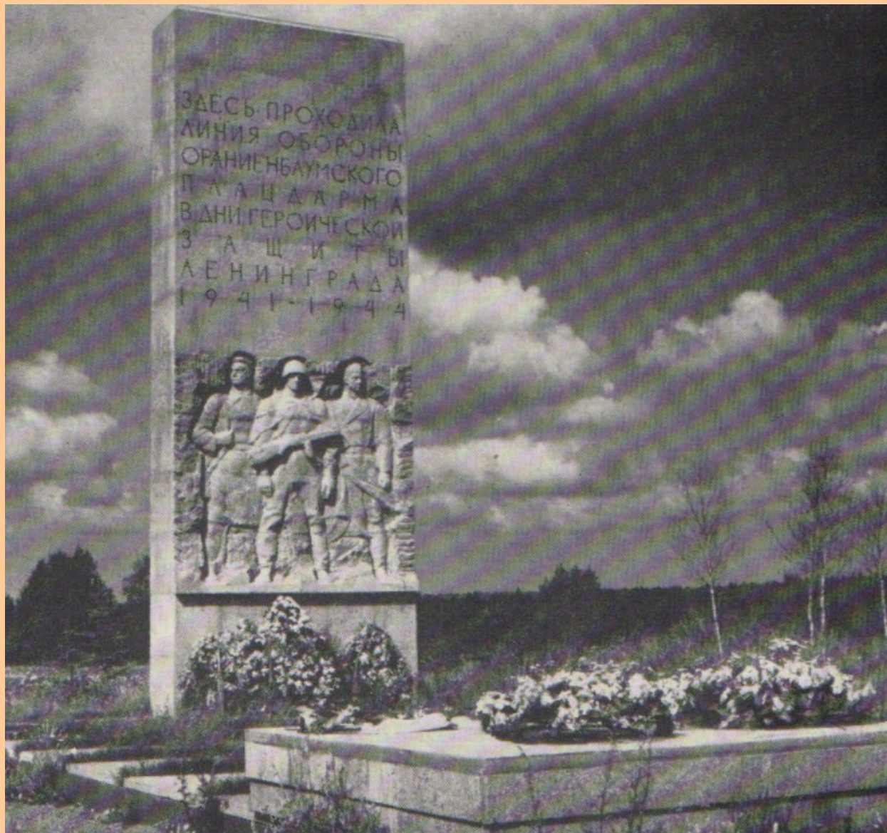
Памятник «Январский гром» на 19-м км Гостилицкого шоссе