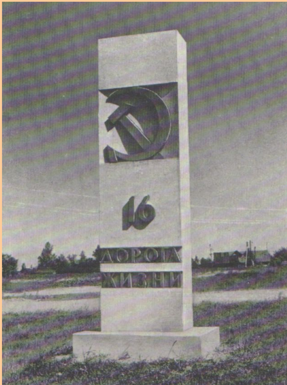
Мемориальный километровый столб на Рябовском шоссе