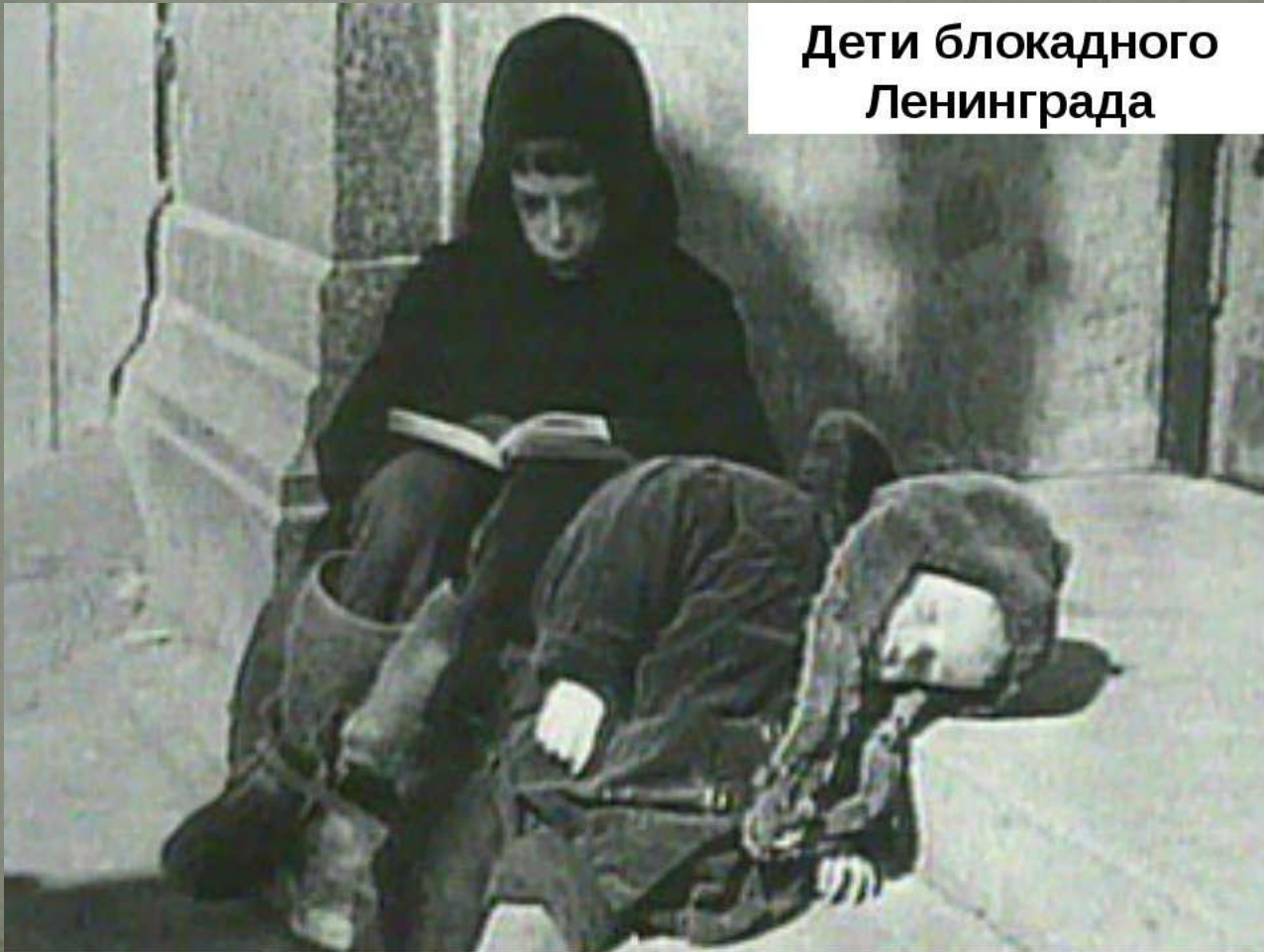
Дети блокадного Ленинграда

Не выпало им дописать , дочитать , когда навалились на город , фугасные бомбы и голод.