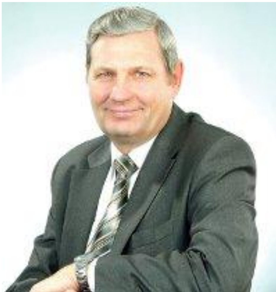
Глава города В.Г. Пфейфер