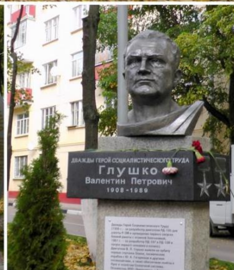
Аллея героям труда