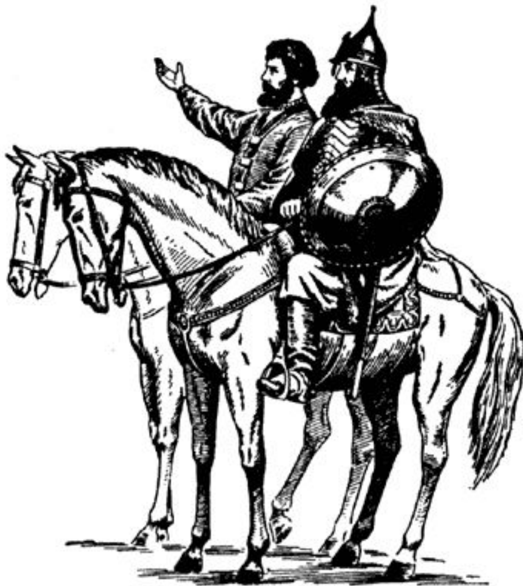
Дмитрий Пожарский и Кузьма Минин