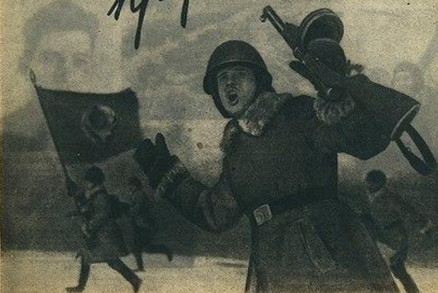
СЛАВА ДОБЛЕСТНОЙ КРАСНОЙ АРМИИ СЛАВА ГЕРОИЧЕСКИМ ЗАЩИТНИКАМ ЛЕНИНГРАДА! Войска Волховского и Ленинградского Фронтов после славной битвы прорвали 19 января Блокаду Ленинграда и освободили район дачной проточки и заставы «Большой Третьяк» (на снимке). Батальоны маршируют в атаку.