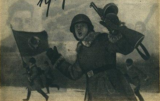
СЛАВА ДОБЛЕСТНОЙ КРАСНОЙ АРМИИ СЛАВА ГЕРОИЧЕСКИМ ЗАЩИТНИКАМ ЛЕНИНГРАДА! Войска Волховского и Ленинградского Фронтов после славной битвы прорвали 19 января Блокаду Ленинграда и освободили район дачной проточки и завода «Большевик» (на снимке). Батальоны маршируют в атаку.