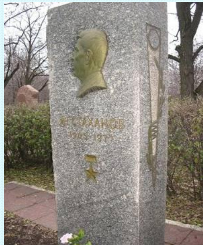
Здесь похоронен Алексей Григорьевич Стаханов.