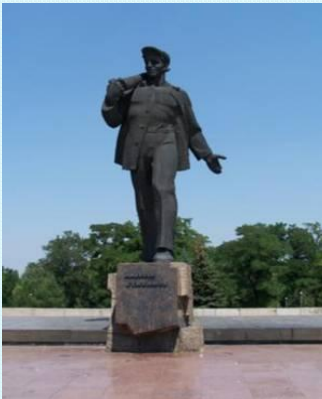
Памятник Алексею Стаханову