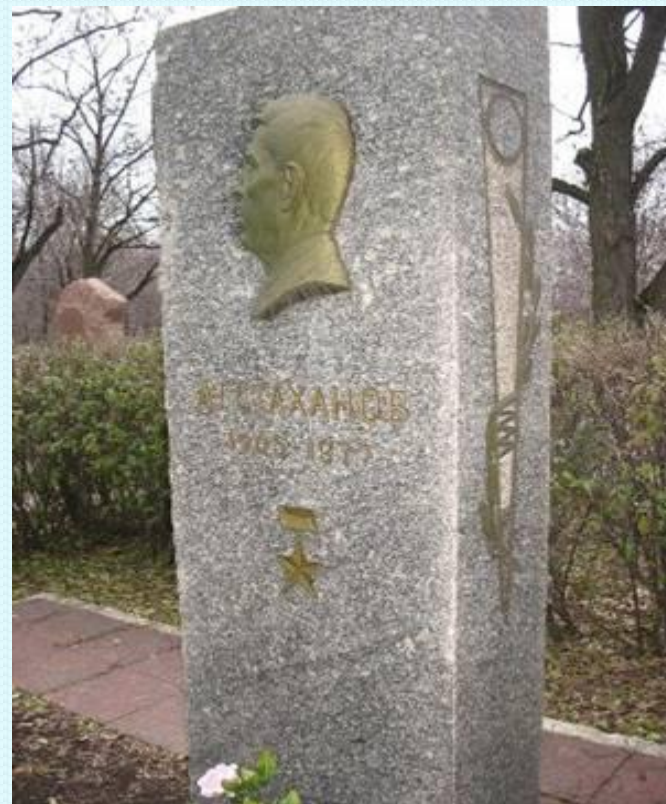
Здесь похоронен Алексей Григорьевич Стаханов.