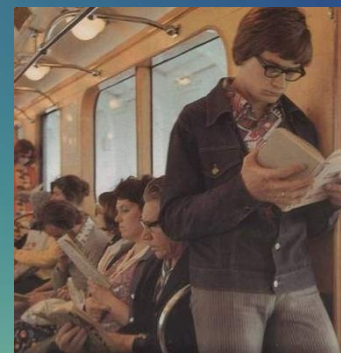
Чтение в транспорте