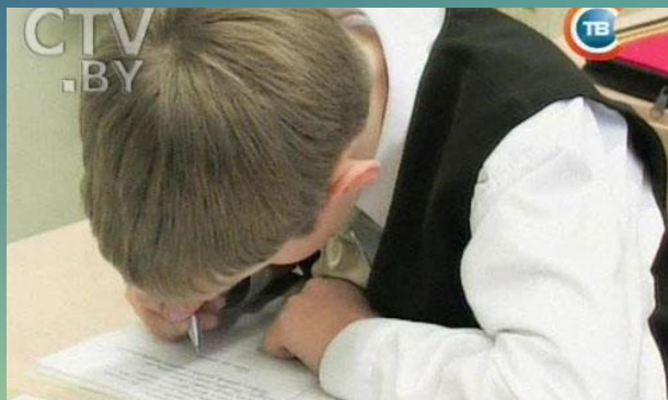
Чтение с опущенной головой

Не склонять низко голову, "не писать носом"