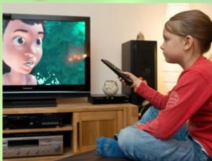
Долго и близко смотреть телевизор