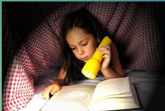
Чтение в темноте

Не склонять низко голову, "не писать носом"