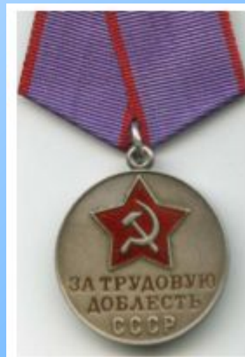
Медаль "За трудовую доблесть"