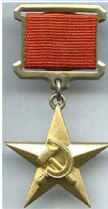
Медаль "Герой труда"