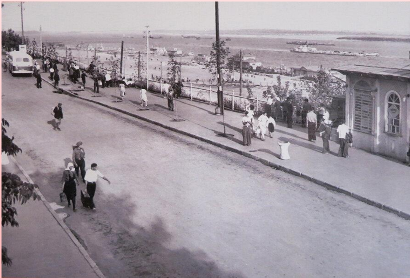
Старая Набережная Космонавтов