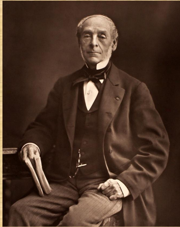
Французский писатель – мыслитель Эрнст Легуве

«Цель воспитания - научить наших детей обходиться без нас».