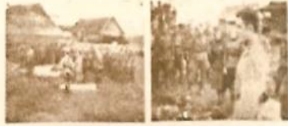
Митинг у могилы героя