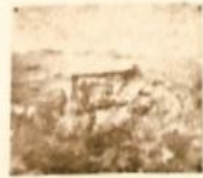
После боя у г. Шауляй