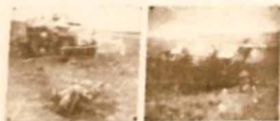
Танк подбитый А. Мишиным.