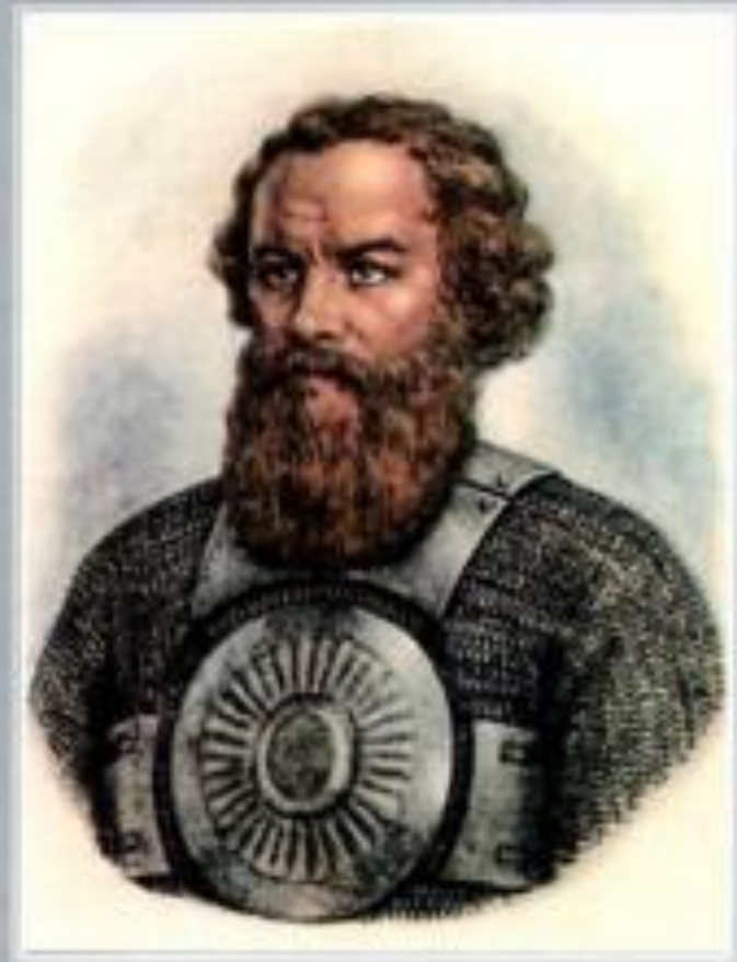
Князь Дмитрий Пожарский и Кузьма Минин.