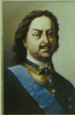
ПЕТР I ВЕЛИКИЙ (РОМАНОВ Петр Алексеевич) 1672-1725

Петр I Великий (1672-1725) — великий русский полководец, император Всероссийский, основатель династии Романовых. Он известен своими реформами и модернизацией России. Петр I сыграл важную роль в развитии русской армии и флота, а также в установлении дружеских отношений с европейскими державами.