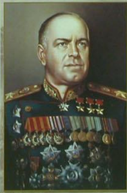
ЖУКОВ Георгий Константинович 1896-1974

Георгий Константинович Жуков (1896-1974) — великий русский полководец, маршал Советского Союза, князь Жуков. Он известен своими победами над немецкими войсками в битвах при Сталинграде (1942-1943) и Берлине (1945). Жуков сыграл важную роль в развитии русской армии и флота, а также в установлении дружеских отношений с европейскими державами.