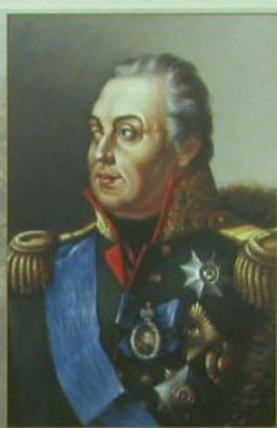
НАХИМОВ Павел Степанович 1802-1835

Михаил Илларионович Голенищев-Кутузов (1745-1813) — великий русский полководец, генерал-фельдмаршал, князь Голенищев-Кутузов. Он известен своими победами над французами в битвах при Прозорове (1805) и Бородине (1812). Кутузов сыграл важную роль в развитии русской армии и флота, а также в установлении дружеских отношений с европейскими державами.