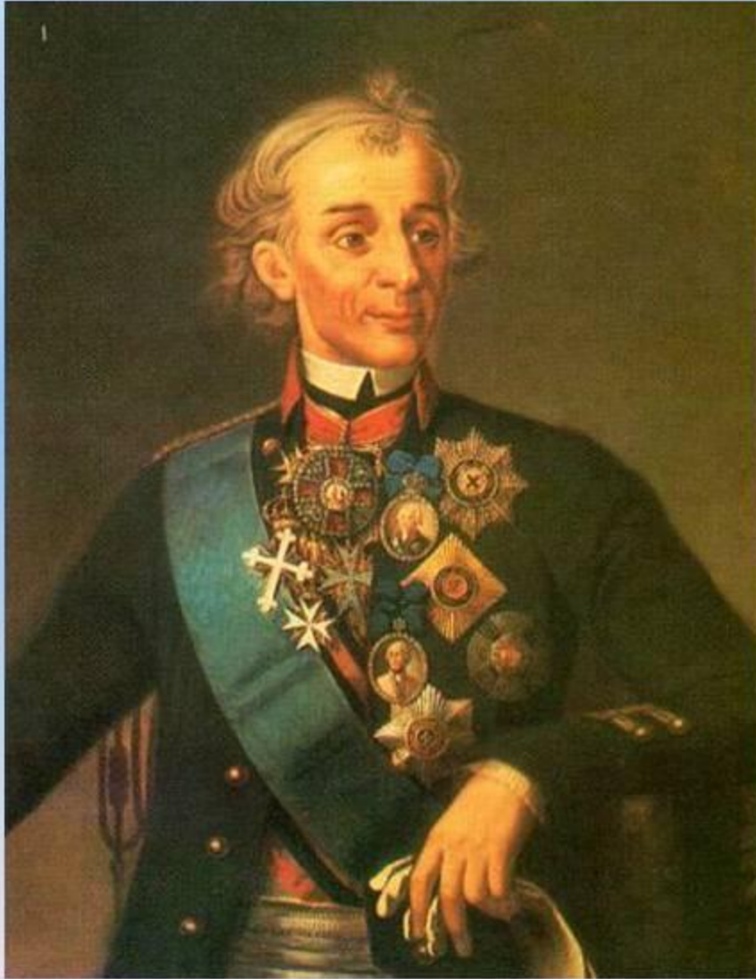
Суворов Александр Васильевич

Суворов Александр Васильевич (1730-1800) - великий русский полководец.