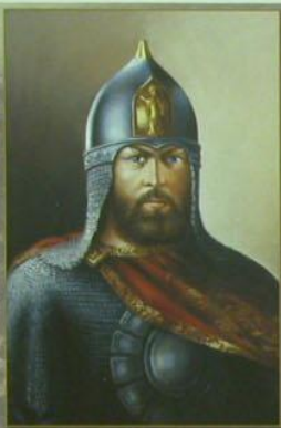
ДМИТРИЙ ДОНСКОЙ 1350-1389

Александр Невский (1230-1263) — великий русский полководец, князь Новгородский, князь Псковский, князь Тверской, князь Рязанский, князь Смоленский, князь Киевский. Он был сыном Александра Ярославича и княгини Ингиры. Александр Невский известен своими победами над крестоносцами в битвах на Неве (1240) и Чудском озере (1242). Он также известен своим дипломатическим талантом и способностью укреплять единство русских земель.