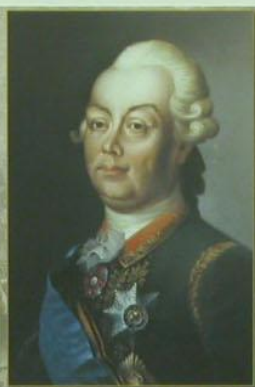
СУВОРОВ Александр Васильевич 1730-1800

Петр Александрович Румянцев (1725-1796) — великий русский полководец, генерал-фельдмаршал, князь Румянцево-Пулеский. Он известен своими победами над турками в битвах при Ларге (1770) и Кагуле (1791). Румянцев сыграл важную роль в развитии русской армии и флота, а также в установлении дружеских отношений с европейскими державами.