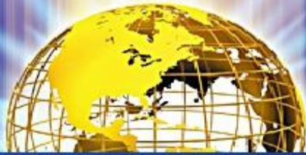
Таблица правил поведения в сети Интернет